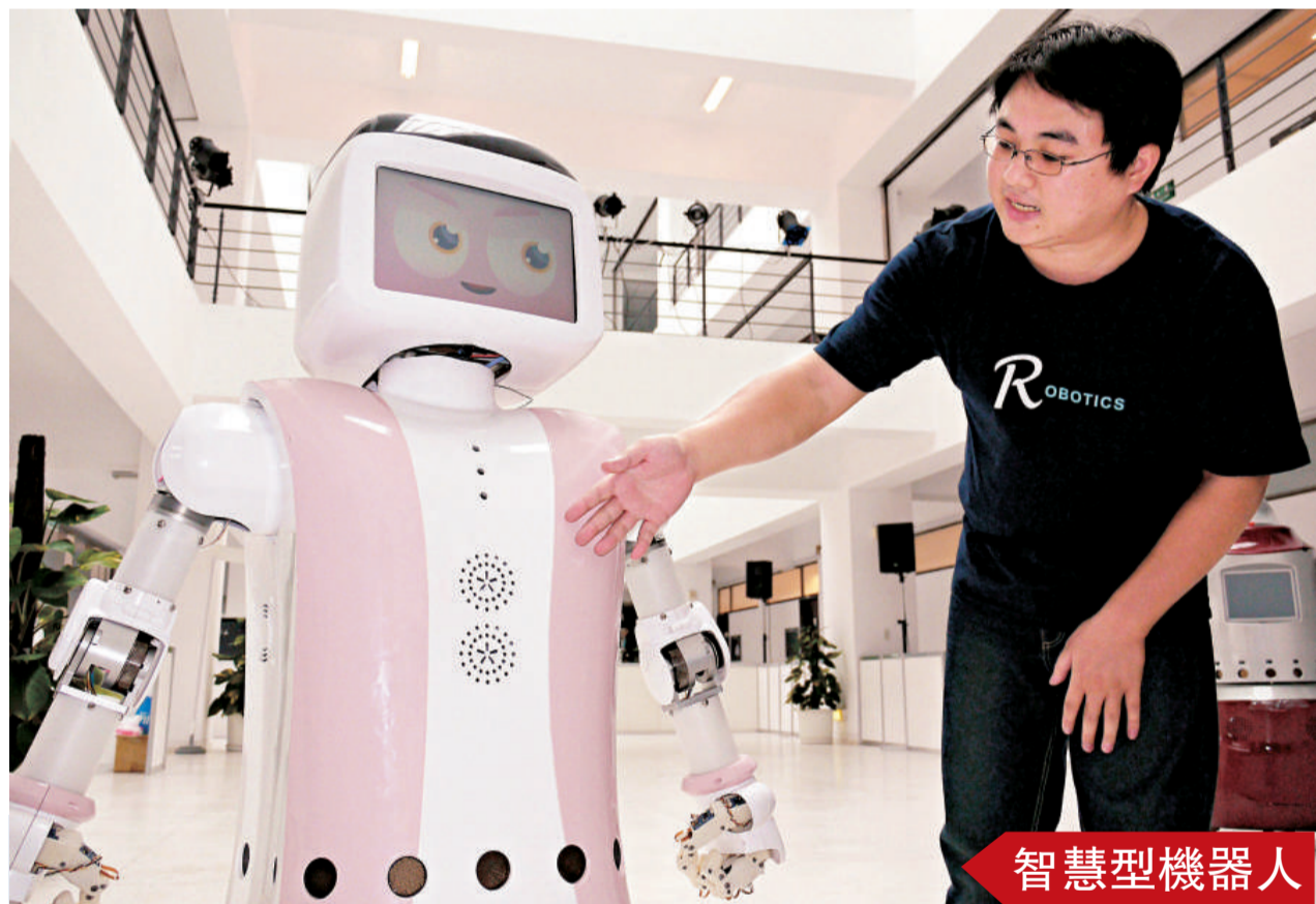
智慧型機器人前瞻技術開發計劃十六日在台灣大學舉行研發成果發表，台大、元智等校聯合團隊現場展示醫療用機器人，不但能與人互動，還有臉部識別能力。