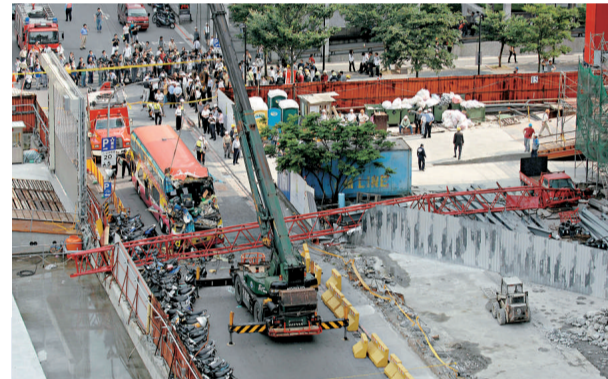
今年四月二十四日台北市信義區發生起重機吊臂掉落砸中大陸廣東旅行團遊覽車意外，造成數人死亡，多人輕、重傷（資料圖片）

台北地院審理後，認為被告因一時失慮，造成意外，犯後已知悔悟，應不再犯之虞，且僱主神州公司也出面與被害人家屬達成和解，故依業務過失致死罪判處十月及八月不等徒刑，均緩刑二年。