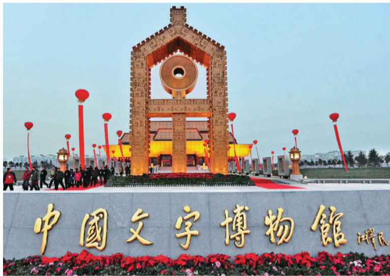
中國文字博物館16日在殷墟所在地河南省安陽市開館

【本報記者高毅河南安陽十七日電】經過近三年的場館建設、文物徵集和陳列布展工作，中國首座國家級文字博物館16日在殷墟所在地河南省安陽市開館。該館也是世界上首個以文字為「藏品」的國家級博物館。當天，司母戊鼎、吳王光鑑、子魚尊、秦二世元年詔版等16件「國寶級重點文物」同時展出。目前，中國文字博物館共入藏文物4000餘件，其中一級文物305件。知名學者馮其庸受聘擔任中國文字博物館館長。