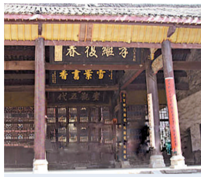
孫康苦讀映雪堂正廳

年(1850年)重建。據介紹，映雪堂是邵東縣文物普查中的重大發現，它具有很高的歷史價值和藝術價值，對研究古代建築和歷史文化提供了寶貴的實物資料。