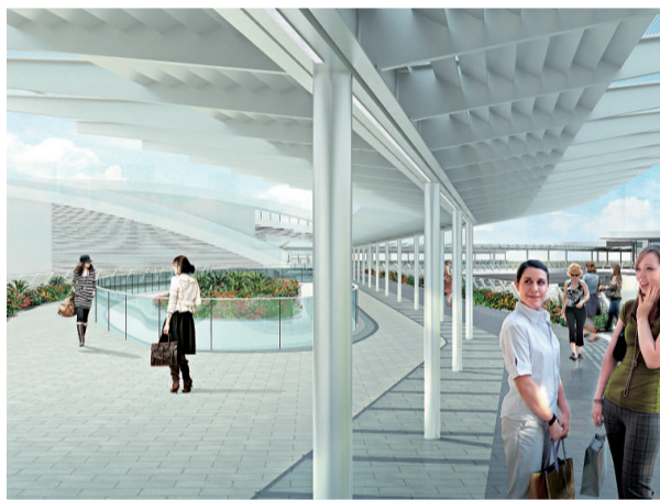
高鐵西九龍總站將會設立行人天橋，連接至柯士甸站及九龍站

此外，當局亦會擴闊及加建高鐵路總站及柯士甸站之間的匯民路，並伸延及連接至欣翔道至海泓道，以提供額外的南北行道路。局方表示，以上道路網絡預計可於二〇一五年或之前完成，相信所有工程完成後，可配合西九龍區直至二〇三一年交通流量的增長，並可改善現時佐敦道及廣東道一帶的交通擠塞問題。