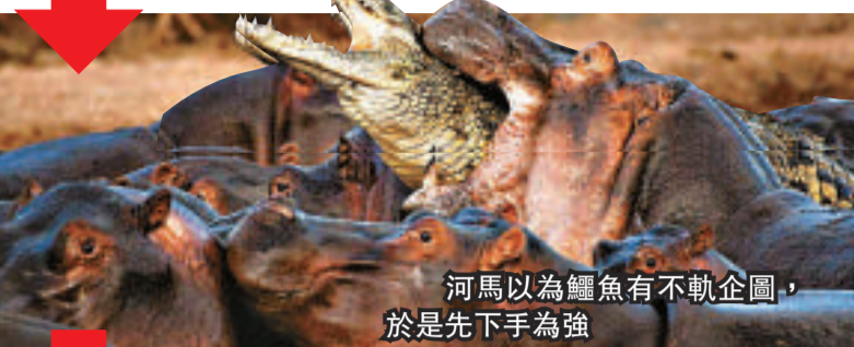
河馬以為鱷魚有不軌企圖，於是先下手為強