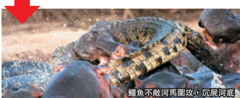
鱷魚不敵河馬圍攻，沉屍河底