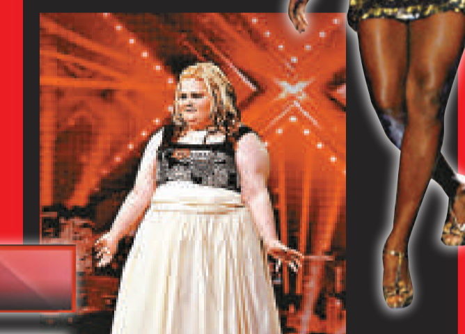
▼ X Factor 的評判會毫無保留地對參賽者進行人身攻擊，務求令觀眾看得過癮