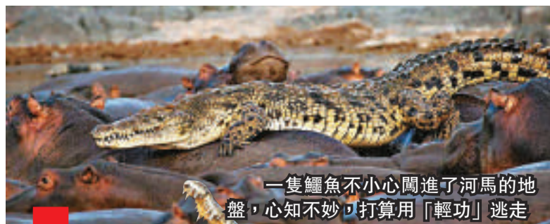
一隻鱷魚不小心闖進了河馬的地盤，心知不妙，打算用「輕功」逃走

及代表那一年的「潮語王」。今年入圍及角逐「潮語王」的生字，除了「unfriend」外，還有「netbook」（時下大受用家歡迎的小型電腦）、「sexting」（意思指利用流動電話傳送淫聲或與性愛有關的文字訊息或圖片），結果由「unfriend」贏得桂冠。（法新社）