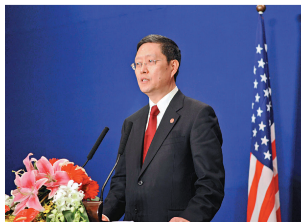
▲外交部副部長何亞非昨日介紹奧巴馬訪華情況

關於人權問題，何亞非說中美雙方表示，相互尊重各自對發展道路的選擇。在人權問題上，雙方有分歧，但是都願意在平等、相互尊重的基礎上來討論和解決這些問題。中美兩國也決定在二〇一〇年年初，舉行一輪新的人權對話。