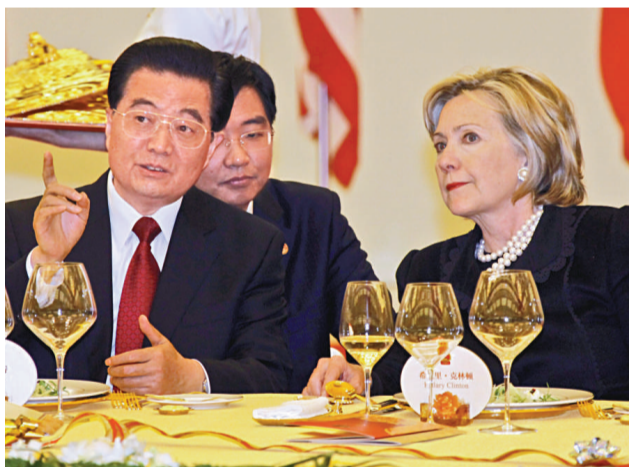
▲中國國家主席胡錦濤昨晚在宴會上與美國國務卿希拉里親切交談