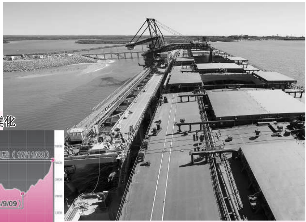
BDI升勢未止，海峽型船現貨日租金重升穿80000美元水

另外，挪威奧斯陸海運衍生產品交易所(Imarex)數據顯示，海峽型船明年首季遠期運費協議(FFA)日租金周一升約49500美元，同期巴拿馬型船FFA日租金則約26750美元。