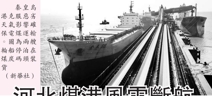
秦皇島港克服惡劣天氣影響確保電煤運輸。圖為兩艘輪船停泊在煤炭碼頭裝貨

租期較長的連續航次租船和包運合同方面，新條款則確保船東更自由地因地因海盜問題而進行繞道，船東和租家將以固有方式計算各自承擔額外開支的比例。