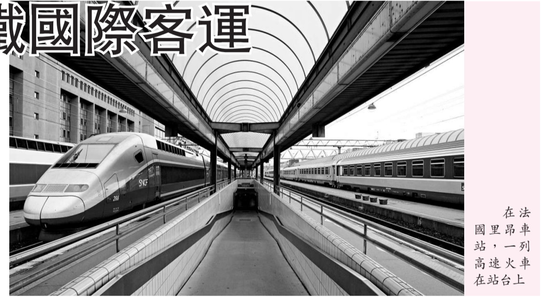
在法國里昂車站，一列高速火車在站台上

長期以來，機構臃腫、職工福利負擔沉重等原因使法國鐵路運輸市場的法國國營鐵路公司一直運營艱難。為此，法國政府2003年3月決定逐步向私營企業開放鐵路運輸市場。截至2006年，法國國內和國際鐵路的貨運市場已經開放，到2010年，國際鐵路客運市場將開放。