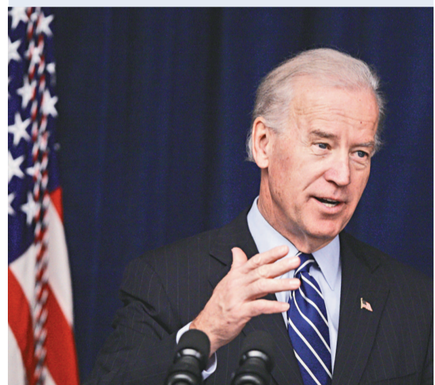
拜登的支持率創下他上任來的新低

拜登目前的支持率已經創下他上任近一年來的新低。根據蓋洛普的民調，拜登的支持率僅有百分之四十二，在他剛上任時，這個數字是百分之五十九。不支持他的比例更從年初的百分之二十九上升到現在的百分之四十。若僅從數字分析，拜登比他的前任切尼更不受民衆歡迎。