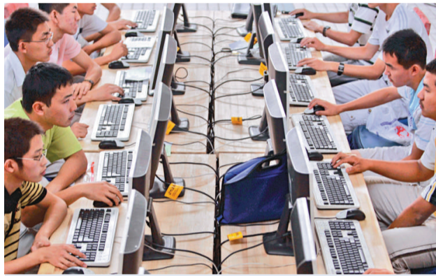
互聯網保安公司發出警告指，全球正爆發一場電子網絡軍備競賽 （資料圖片）

【本報訊】綜合外電報道，著名互聯網保安公司McAfee 星期二發出警告稱，世界正在爆發一場「電子網絡軍備競賽」。美國、中國、法國、以色列和俄羅斯均已經發展「電子網絡武器」，有能力利用互聯網發動攻擊。