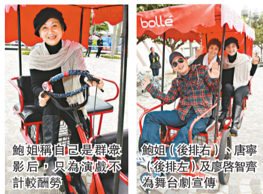
鮑姐稱自己是群眾影后，只為演戲不計較酬勞

非度蜜月。他不諱言婚禮得到不少贊助，令他慳了約六位數字，他開心道：「我只需要買結婚戒指就可以，(婚戒有多少卡?)用六位數買了一卡鑽戒，老婆喜歡就行。」最近他又領悟到結婚其實不是墳墓，而是自由，因婚後不用再想其他女仔，可以專心工作。