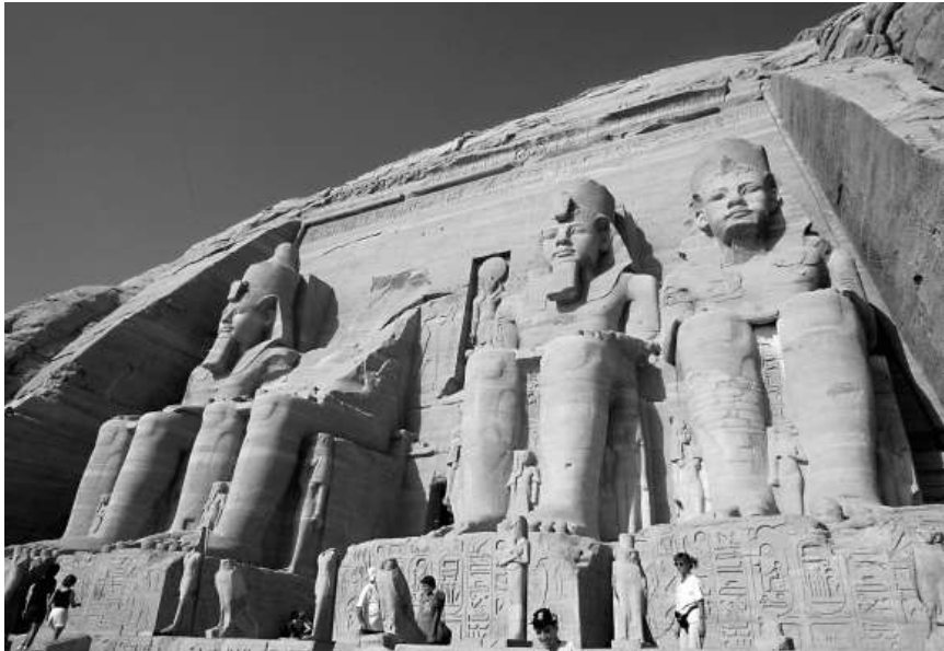
埃及阿布辛比的拉美西斯二世神廟