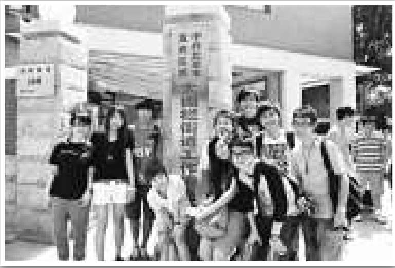
▲與其他港專實習同學一起遊走於北京的大街小巷

北京人的處事方式比較溫和，在表達意見時十分客氣，令我覺得「少說話，多做事」是這份工作的一大特色，公司安靜得連呼吸聲也可聽見；但隨着大家開始認識了解和互相分享，藉着魔術表演、摺紙飛機等小玩意，令大家在不知不覺中展現燦爛的笑容，這股快樂的感染力漸漸消除了工作上的拘謹。