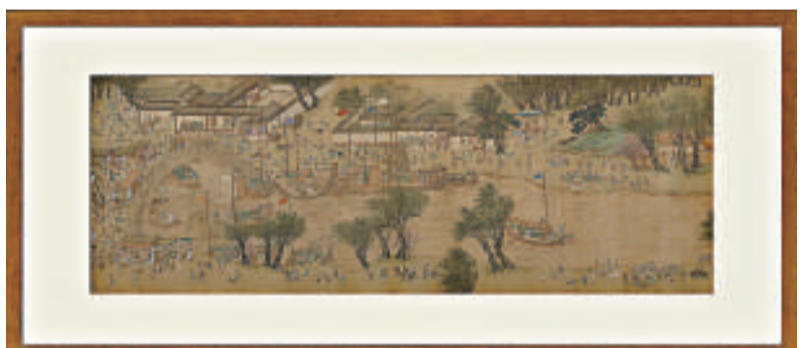
仇英《清明上河圖》複製本