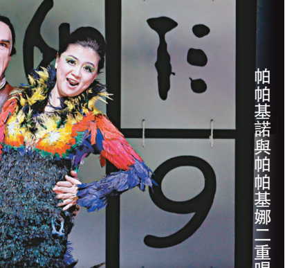
帕帕基諾與帕米娜二重唱