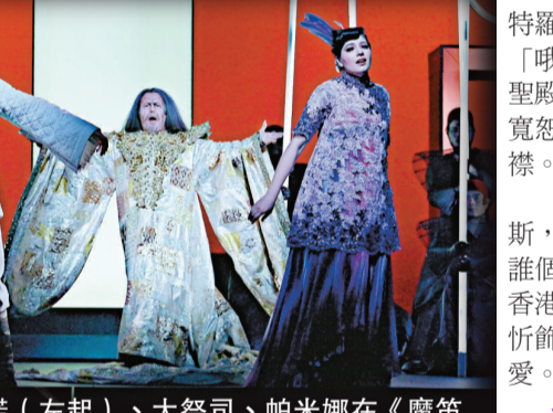
塔米諾（左起）、大祭司、帕米娜在《魔笛》中各有鮮明性格

《魔笛》的角色形象鮮明、性格各異，塔米諾的機智，祭司薩拉斯特羅的善良，夜後的冷酷，帕米娜的可愛，帕帕基諾的幽默，帕帕基諾的活潑等，有聲有色。