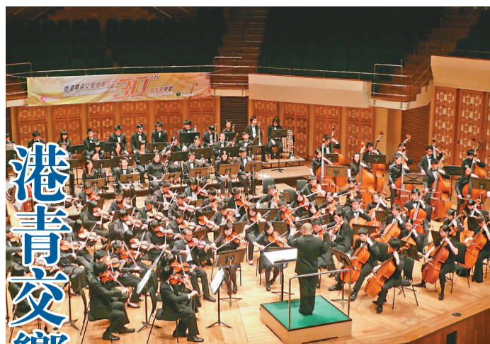
香港青年交響樂團將舉行演奏會

【本報訊】香港青年交響樂團將於本月二十二日（星期日）晚上八時，在荃灣大會堂演奏廳演出一場「情迷意樂」音樂會。