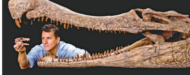
最早被人發現的超級鱷，重量達八噸，長十二米