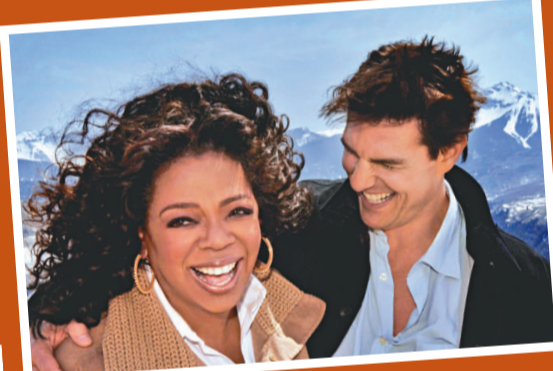
▲「靚佬湯」與奧花交情不淺