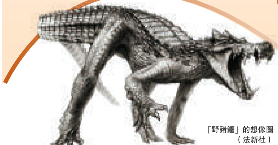
「野豬鱷」的想像圖