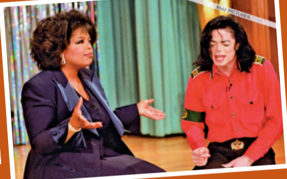
▲奧花專訪米高成經典 (資料圖片)