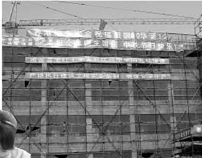
▲11月20日，香港紅十字會援建的安縣秀水鎮民興初級中學進行了教學樓綜合樓主體驗收 ▲綿陽市遊仙區中興鎮初中學生暫仍在板房上課

金發放工資，施工單位在辦施工證前還要向建設局繳納工資保證金，大約是工程造價的3%。作為本地建築企業，雖然現在不到10%的利潤遠比不上震前的15%的建築行業利潤豐厚，也應該為當地奉獻一分力量。 香港特區援建綿陽市的項目共有26個，總投資92661萬元。其中教育項目7個，總投資32533萬元；衛生項目10個，總投資48090萬元；社會福利項目1個，總投資2554萬元；殘疾人項目8個，總投資9484萬元。開展招投標工作項目2個，魏城鎮中心學校和梓潼縣文昌初級中學已完成招投標，正在簽訂協議，施工隊即將進場施工；截至10月30日，已開工項目年度累計完成投資2515.19萬元。