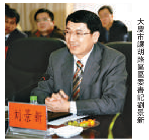
大慶市讓胡路區區委書記劉景新

在工業經濟快速發展的同時，讓胡路區第三產業以迅猛之勢佔據經濟發展一席之地。目前，三產業已發展到近2500家，其中，規模以上企業達到60餘家，註冊工商戶近20000戶，從業人員近10萬人，三產完成增加值35.5億元，佔地區生產總值的58.99%，同比增長