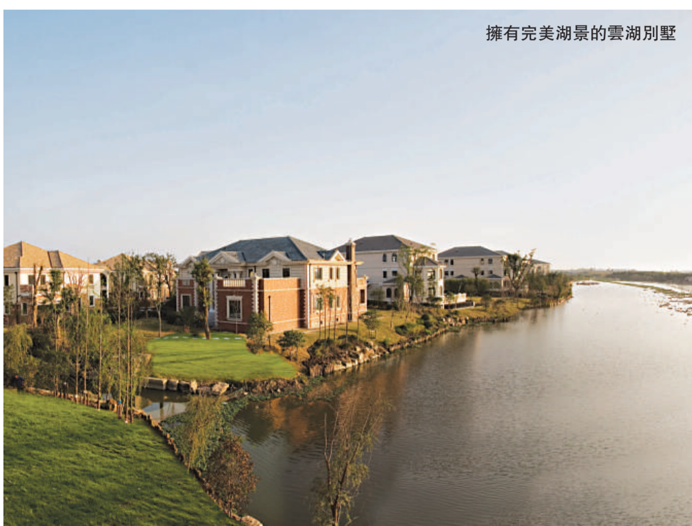
擁有完美湖景的雲湖別墅

目前，淀山湖國際別墅區擁有眾多的高端別墅項目，雲湖遊艇別墅、大自然花園、納帕爾灣、富力灣、淀湖桃源等別墅樓盤。而雲湖別墅作為區域內定位元最高端的项目之一，更是從規劃之初即鎖定國際頂級標準，按照國際化豪宅標準打造。