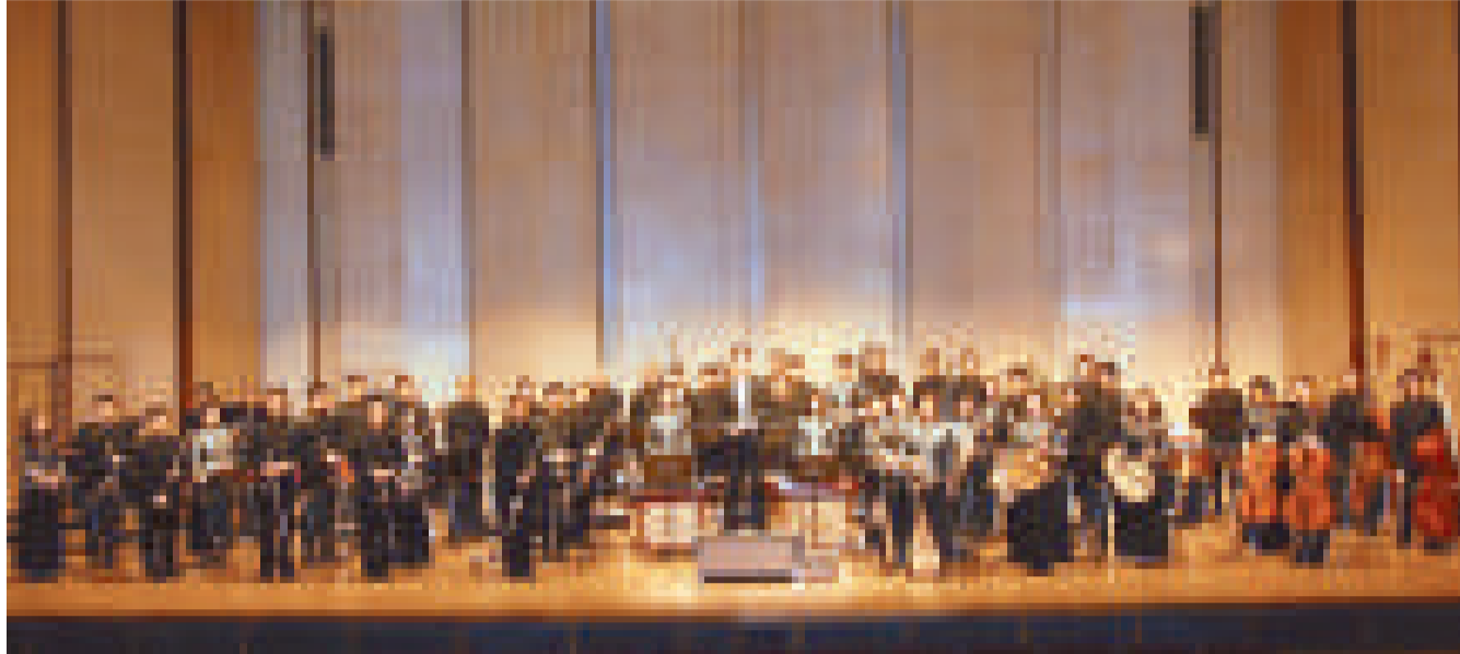
▲香港愛樂民樂團慶祝成立三十周年

該音樂會節目包括，充滿民族色彩的合奏樂曲，中國人視之為吉祥象徵的《龍》；古曲《月兒高》，描寫月亮從東海升起，沉沒於西山的過程，意境典雅、雄渾兼而有之，兩首樂曲透過易有伍細膩的處理，在指揮台上盡顯錄音大師的功架。流行於上世紀六、七十年代