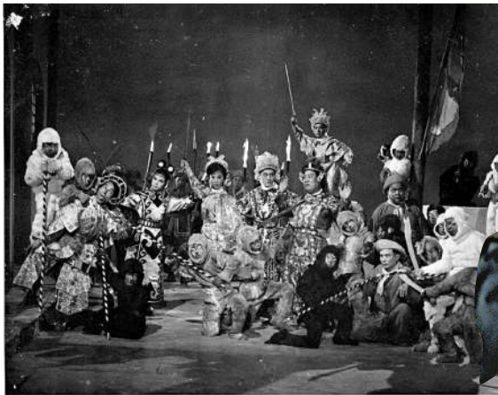
▲《猴子兵華山救駕》裡的猴子兵騰空跳躍，看得觀眾心花怒放 ►成龍（右）在《新精武門》中的打鬥場面