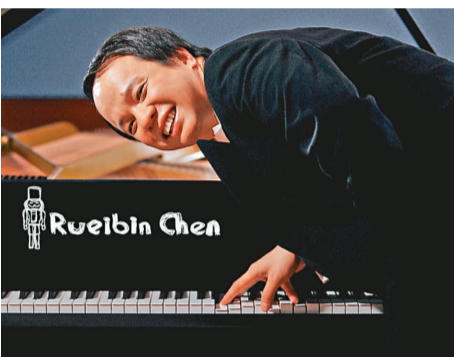
▲奧地利籍華裔鋼琴演奏家陳瑞斌