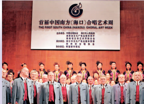
男聲合唱團與海南合唱團在音樂會上獻唱

此次合唱周是海南島歡樂節期間海口地區舉辦的重要活動，合唱周為期五天，昨天閉幕。合唱周舉行了合唱音樂會、比賽、專家講座、廣場展演等系列活動。預計以後合唱周每兩年舉辦一次，海口將通過舉辦合唱周而成為知名的冬季合唱基地。