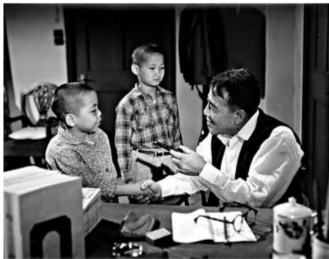
▲洪金寶（中）初登大銀幕之作《愛的教育》 ▲洪金寶（左）自導自演的《三德和尚與春米六》