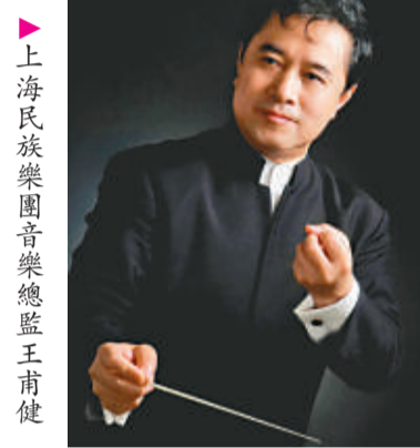
▲上海民族樂團音樂總監王甫健