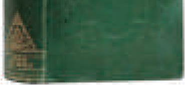
▲達爾文《物種起源》的初版