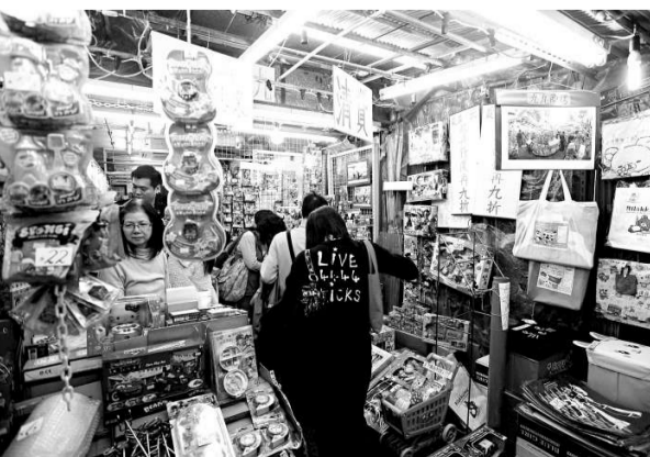
▲牛頭角下邨玩具店人頭湧湧

房屋署由今日開始，正式清拆牛頭角下邨第八座至第十四座樓宇，今日晚上八時起，各座的出入口將正式關上，樓宇的水電服務亦隨即中止，所有商戶、租戶將於今日