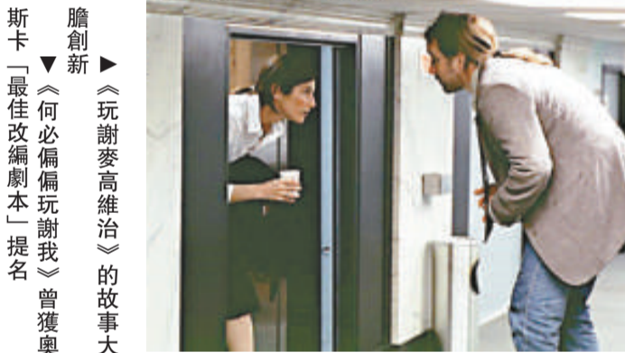
▲《何必偏偏玩謝我》曾獲奧斯卡「最佳改編劇本」提名