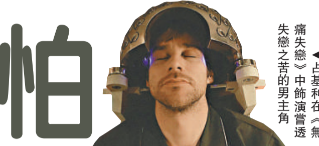
▲查理考夫曼在《無痛失戀》中飾演的男主角

有點夫子自道況味的《何必偏偏玩謝我》，是考夫曼自嘲與自省的一次創作之旅，藉故事男主角查理的遭遇，勾畫出創作人的困境之餘，也嘗試大玩現實和虛構生活重疊的把戲。而最叫觀衆看得入心入肺的《無痛失戀》，考夫曼透過一個飽受失戀之痛困擾的男人天天跑去找醫生洗腦要求重生、重來，來窺探感情與記憶之間的巧妙的關係，以及男女感情糾纏不清的微妙演變。