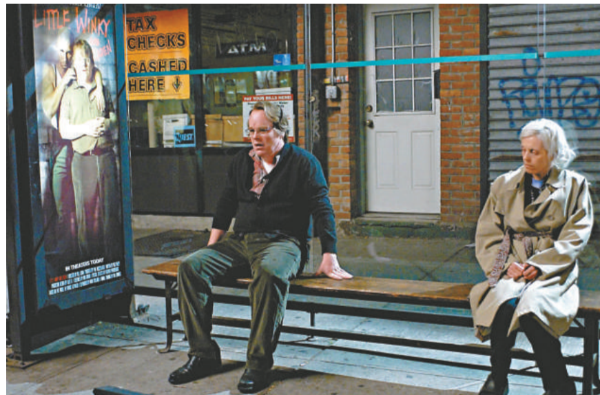
▲菲臘西爾荷夫曼（左）在《腦作大業》裡飾演陷入人生低潮的劇場導演，決意在有生之年籌拍一齣佳作