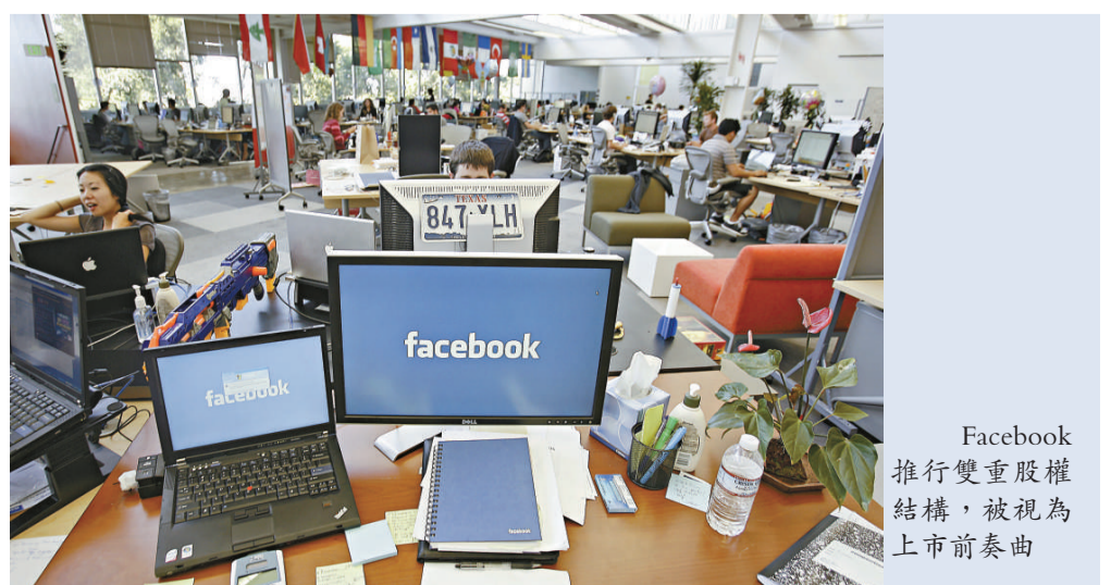
Facebook推行雙重股權結構，被視為上市前奏曲

辦人扎克伯格在五月時曾經表示，預期Facebook會上市，但他本人並不專注在此事。Facebook最新舉動令人不禁想到Google。當年Google在2004年上市之前，亦引入雙重股權架構，Google兩位創辦人佩奇與布林每持1股，就有10票表決權，而非一般的每1股1票表決權。紐約時報、君悅酒店、巴郡也是推行雙重股權架構的公司。IPO Desktop分析指，Facebook採用雙重股權結構，顯然想進行IPO，沒有別的理由。