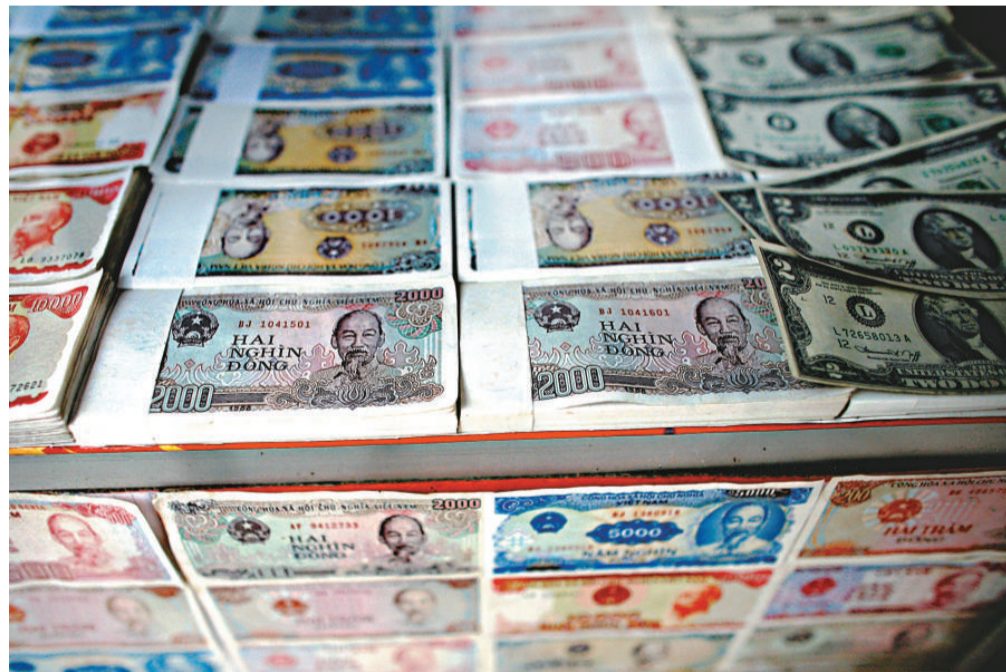
越南國家銀行昨日決定將越南盾匯價下調5.44%

大，部分分析師對該國央行今次採取的貨幣政策能否取得長期效果表示質疑。渣打銀行認為，越南經濟的現狀與其他亞洲國家完全不同。該國加息旨在支持越南盾匯價，將越南盾貶值的做法則是為了推動出口。該行分析師還指出，越南盾匯價仍被高估，該國存在國家信用受損的風險。