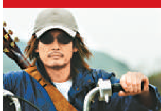
▲失蹤多時的健次終於再次出場 ▼伽南成為「冰之女王」，對抗「朋友」

▲《20世紀少年最終章：我們的旗幟》為三部曲的完結篇 ◀「朋友」的身份在結局中正式曝光 ▼落仔率領「健次一派」和「朋友」展開激戰