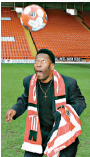
比利獲國際足聯評為20世紀最偉大的兩名球員之一，另一位是阿根廷的馬勒當拿

在世界足球史上，比利是至今唯一3奪世界杯金牌的運動員；他參加過1364場比賽，共踢進1282個球，這個紀錄亦是唯一的。然而，比利的偉大之處，還在於其影響力遠遠超出體育界和國界。他在球場上的勝利，提升了巴西人民的民族尊嚴；而在非洲，他亦是億萬人的偶像，是使他們揚眉吐氣的黑人英雄。更令人驚嘆的是，戰爭亦因比利而暫停。1970年，比利到內戰頻仍的尼日利亞踢表演賽，政府軍和反對派軍隊為此達成協議，停火48小時，因為他們都要看比利踢球。