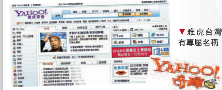
▲雅虎香港主頁面港味十足

和之前介紹的Google相比，港人似乎更慣於使用雅虎（Yahoo！）網站，很多服務，像是雅虎郵箱和博客都備受網民青睞。