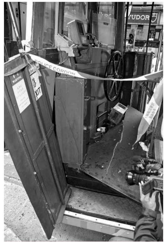
▲肇事電車的車頭及司機位受損嚴重 (本報攝) ◀銅鑼灣電車迎頭相撞事故現場 (本報攝)