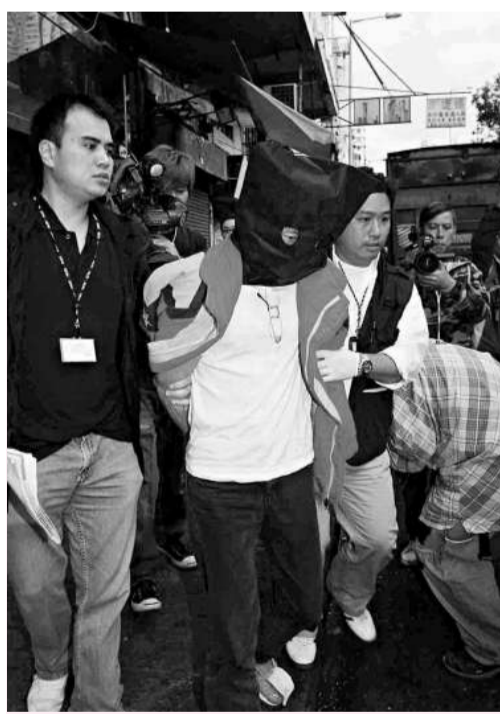
▲涉案疑匪被探員蒙頭帶走

【本報訊】深水埗南昌街一間海味舖昨晨發生鑿牆爆竊案，被掠走逾百萬元參茸燕窩等物，四名歹徒膽大包天，即日在附近通州街「打包」運貨，有重案組探員調查該案經過上前查問，歹徒作賊心虛欲逃，終被一網打盡起回贓物；其中一名疑犯曾逃跑近千米，在深水埗警署附近就擒。