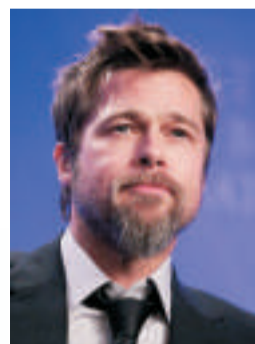
▲荷里活明星畢彼特

現時，迪拜市內和周邊地區許多地產項目已經停工。自從地產泡沫爆破以來，據報當地總共有四百多個工程項目被迫取消，涉及的款項超過三千億美元。