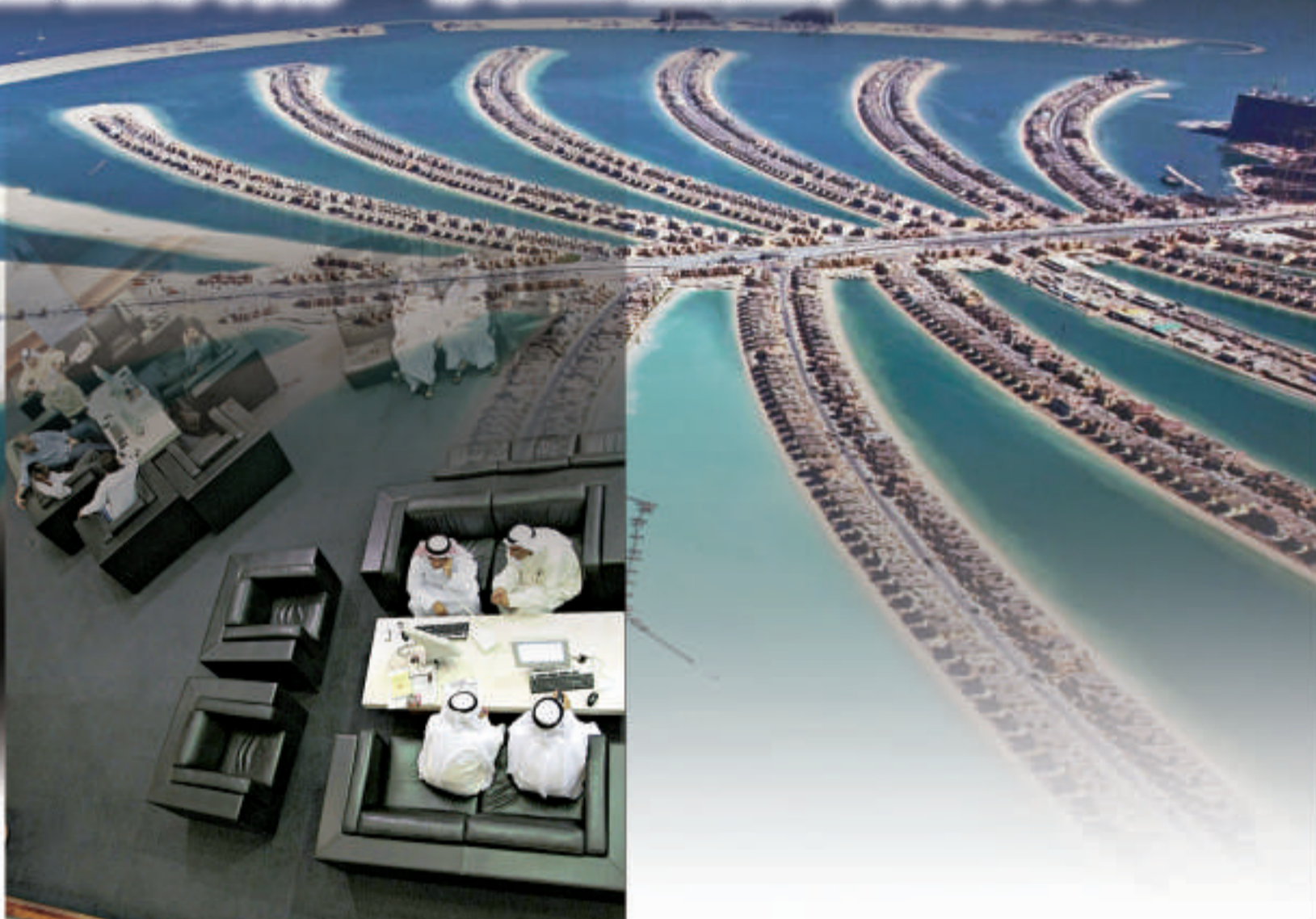
▲迪拜傑貝阿里棕櫚島的俯視圖