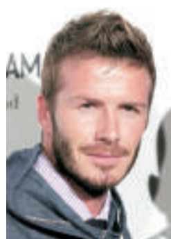
▲英國足球明星碧咸