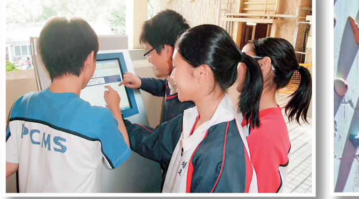
踏足英語遊戲徑，同學需要回答問題並取得一個資訊站的地点提示

於二零零九年九月開始實施新高中課程的發展，所定下之「生命成長、生命陶造」、「更新課程、更新學習」及「知識管理、知識創新」三個重點發展方向，藉此培育學生「學做人、增知識及長智慧」。