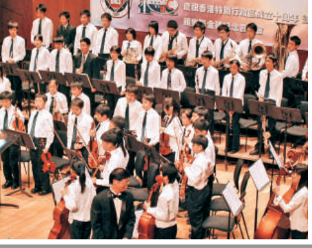
樂隊五十年紀念音樂會