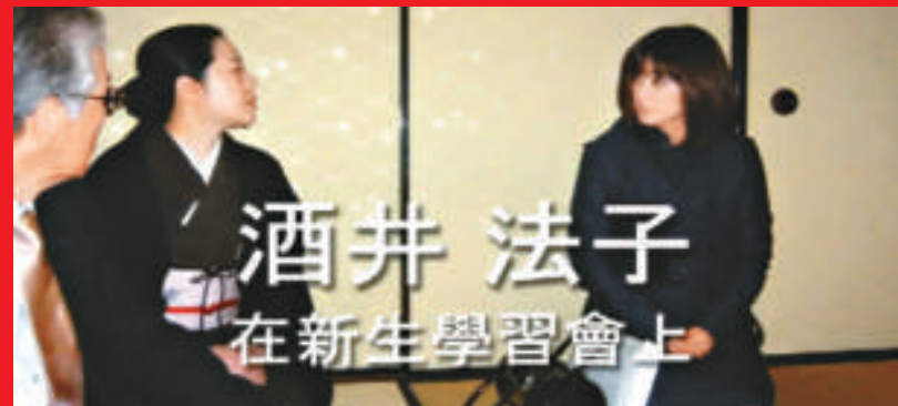
▲片段中的酒井法子（右）在學習茶道的情况 ▲酒井法子（中）與同學拍大合照，有如做show