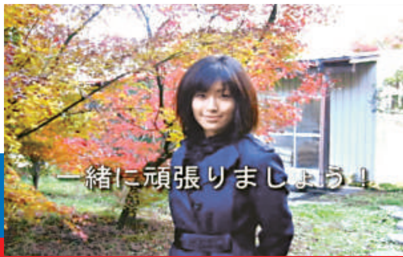
▲酒井法子為創造學園大學做代言人，片段於網站「YouTube」播放

檢控官指，高相有明顯的毒癮，亦視吸毒為常習，藏有的興奮劑數量足以吸食三百次之多，而且他熟知購買毒品的途徑，因此再犯的可能性甚高，要求判高相入獄兩年；而辯護律師則向裁判官求情，表示高相已坦白交代出購買毒品的的方法，而且其父母亦答應協助他重新做人，希望裁判官能判緩刑。如果控辯雙方都不上訴的話，高相的罪名會在下月十一日確定，外界估計他到時便可與酒井見面，商量離婚事宜。