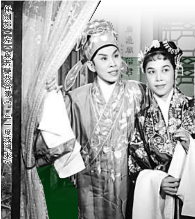
任劍輝（左）與芳艷芬合演《一年一度燕歸來》