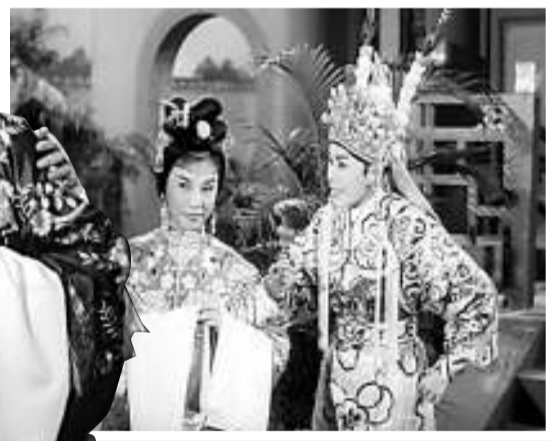
任劍輝（右）與鄧碧雲合演《虎將爭妻》