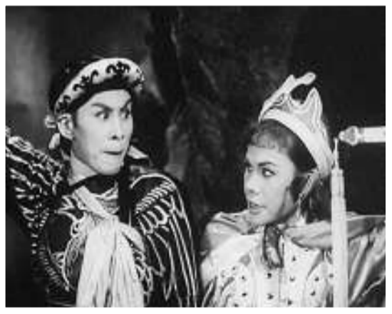
任劍輝（左）和刀馬旦余麗珍合演《神鷹飛天俠》

「永遠的戲迷情人——紀念任劍輝逝世二十周年」開幕電影為任白戲寶《蝶影紅梨記》，將於十一月三十日在香港文化中心大劇院放映。陳寶珠、梅雪詩及多位粵劇界人士均會出席當日放映。是次放映的拷貝為目前最完整的版本，並於放映後邀得文化評論人梁欒（吳俊雄）與觀眾討論粵曲、電影及保育之關係。