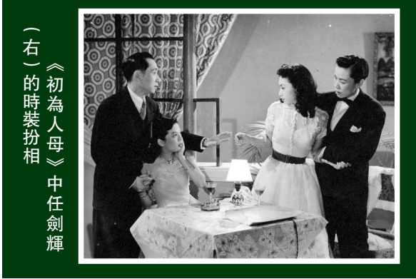
（右）《初為人母》中任劍輝

「仙鳳鳴劇團」為任劍輝、白雪仙所創，唐滌生為劇務主任，以製作嚴謹著稱。《蝶影紅梨記》為仙鳳鳴第三屆演出戲碼，根據元雜劇《謝金蓮詩酒紅梨花》改編，上演後評論與票房俱佳，後由導演李鐵搬上銀幕。影片巧妙結合粵劇與電影兩種媒介的特色，以實而不華的電影化場面調度和剪接，烘托出唐滌生優美的文字，以及任、白與梁醒波的精彩演出。《閨怨》、《窺醉》、《詠梨》等膾炙人口的折子，都拍得非常動人，不但為粵曲電影的典範，更為香港電影史上不可多得之作。是次放映包含市面上影碟沒有收錄之片段，如重頭戲《窺醉》內蝴蝶弄醒男主角，並領他至隔鄰紅梨苑一段。