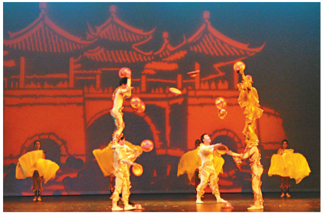
美國休斯敦音樂雜技劇《和諧傳奇》