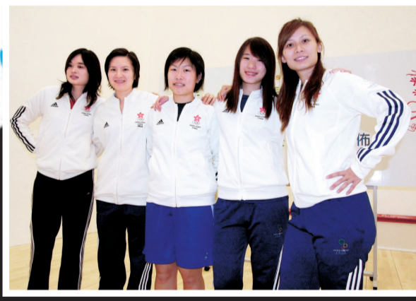
▶港壁球隊劍指7金，女將肩負重任

金牌榜第4名的爭奪則更為激烈，東道主香港、朝鮮及中華台北都有望衝擊該席位。香港今次派出超過400名運動員出戰東亞運，務求在地頭爭取佳績。雖然香港歷屆只累積7面金牌，但今屆賽事香港除了在新增的項目有明顯優勢外，其餘項目亦有望爭牌。香港幾乎肯定能夠突破以往的成績，甚至有機會取得雙位數的金牌。 香港要爭前4，最大的對手當然是中華台北及朝鮮，上屆賽事中華台北以12面金牌成為獎牌榜第4名，雖然今屆賽事取消了軟式網球、空手道及體操等奪金項目，但中華台北仍可藉美式9號球、保齡球項目衝金，保住上屆的成績。朝鮮作風神秘，比賽期間居住酒店改住曹公潭度假村，而且該國實力亦如其風格一樣深不見底，今屆賽事朝鮮隨時殺出，給予觀眾意外的驚喜。