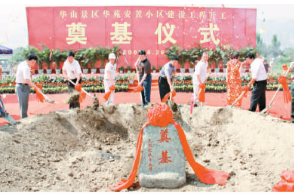
民生安置房工程溫暖人心

同時，決策者們盯緊「構建山水綠色城市」，打造「中國西部旅遊休閒之都」的發展目標，充分利用「華山」這塊招牌，不斷挖掘自然、人文和華陰民俗文化資源，策劃、包裝了華山論劍——世界華人論壇、華山民俗文化產業園、萬畝太華湖景區綜合開發、華陰「西部影視城」拍攝基地、古柏行民俗風情街等數十個項目，其中城市基礎建設、旅遊文化產業、農副產品加工、高新技術產業類項目深受商客青睞。投資上億元的華山與度假山莊項目剛剛啓動；投資2.6億元的五星級華山溫泉