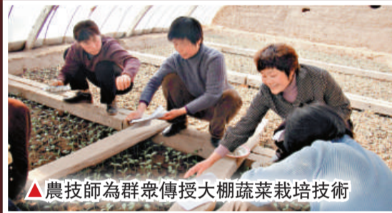
農技師為群眾傳授大棚蔬菜栽培技術