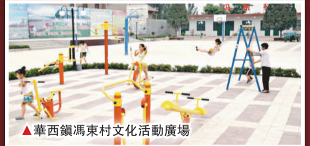
華西鎮馮東村文化活動廣場