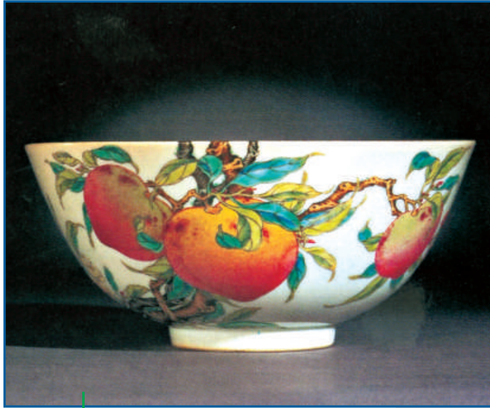
雍正粉彩過牆枝蟠桃紋大碗