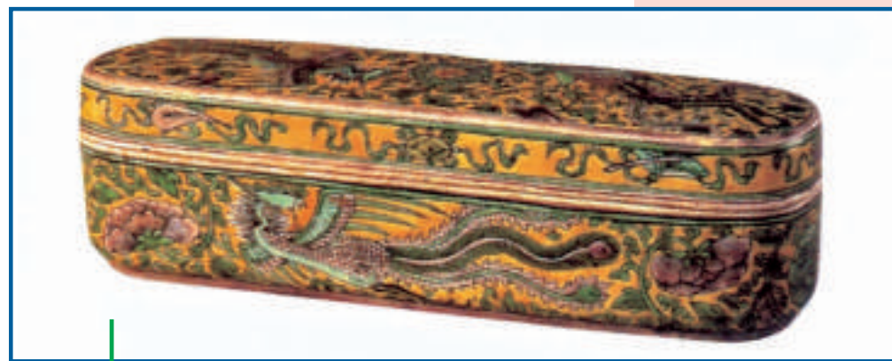
康熙黃地三彩丹鳳長圓盒