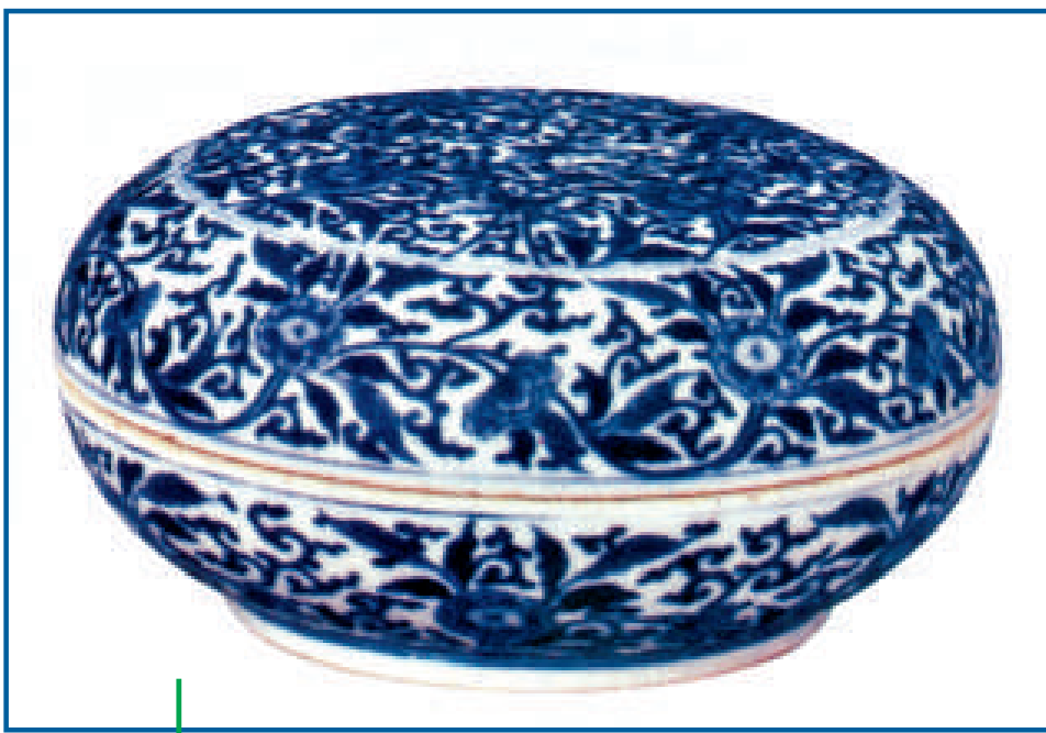
康熙青花蝶紋印泥盒

今天, 隨著我國經濟的飛速發展, 許多人已不滿足於一般收藏, 對高檔藝術品的需求日益殷切, 而高檔藝術品中宮廷藝術品往往成為人們首選品種。對藏家來說, 能覓