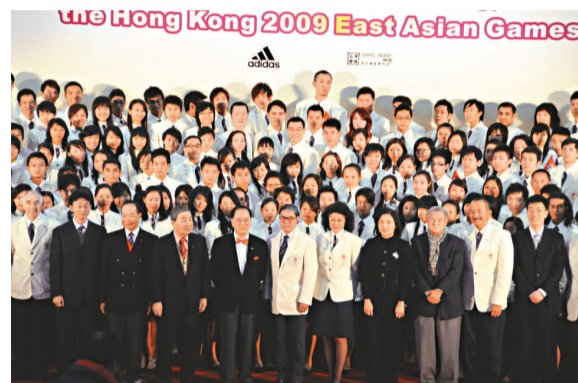
▲香港派出歷來最龐大的代表團，爭取突破過往4屆東亞運的成績

港團金牌及獎牌數固然是今屆東亞運一大看點，同樣要注意的是，在新增的乒乓球與復辦的羽毛球項目中，中日港韓皆是世界級勁旅，而桌球、風帆、單車項目中，中日港韓也屬亞洲頂尖，這些奧運主流項目的吸引力比過往歷屆東亞運更高。