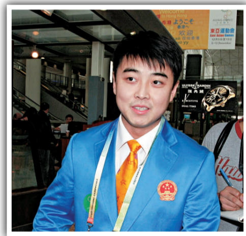
▲國乒主將王皓表示以金牌為目標