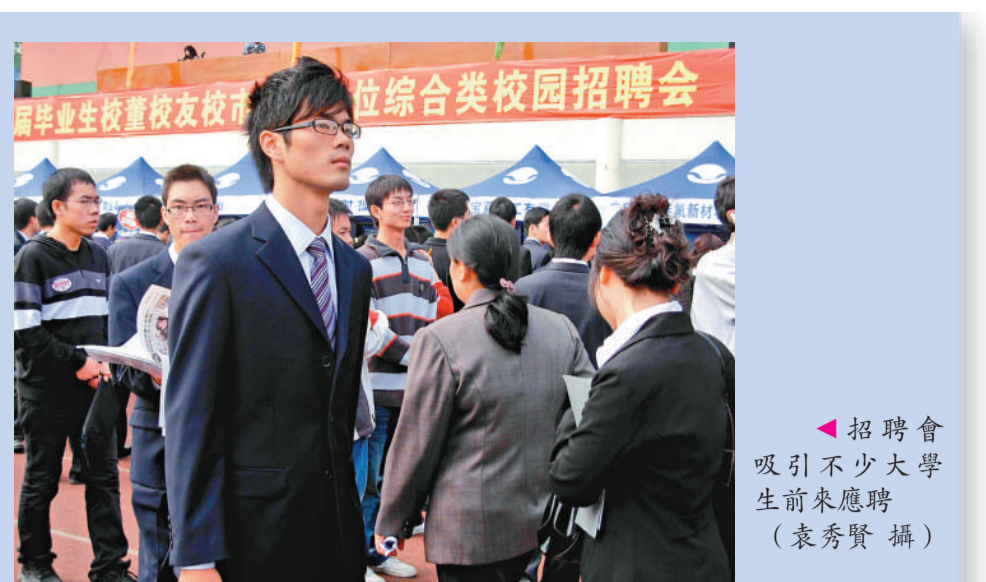
▲招聘會吸引不少大學生前來應聘

在十一月廿日的項目開幕禮中，藝人杜汶澤與一眾香港區扶輪社友一同出席啓動一連串的攝影活動，杜汶澤更鼓勵同學積極面對障礙、學習克服困難，從而融入社群，達致豐盛人生，並對社會作出貢獻。同場亦展示香港紅十字會甘迺迪中心的學生早前於陸運會拍下的照片。