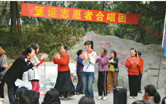
▲亞運志願者合唱團在公園開唱 (本報攝)