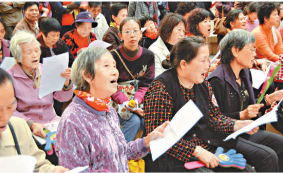
▲志願者唱響亞運歌曲

【本報訊】記者袁秀賢廣州報導：「來啊來啊，伸出你熱情的手；拍啊拍啊，拍得那地動山搖；跳啊跳啊，跳得那熱血沸騰……」首批二〇五名亞運志願者合唱團成員日前在流花湖公園開唱，嘹亮的歌聲在空中回蕩，令寧靜的公園頓時熱鬧起來。