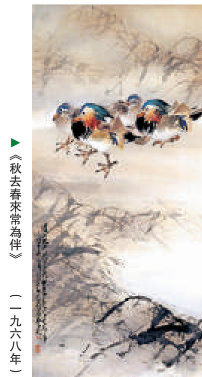
▲《秋去春來常為伴》(一九六八年)