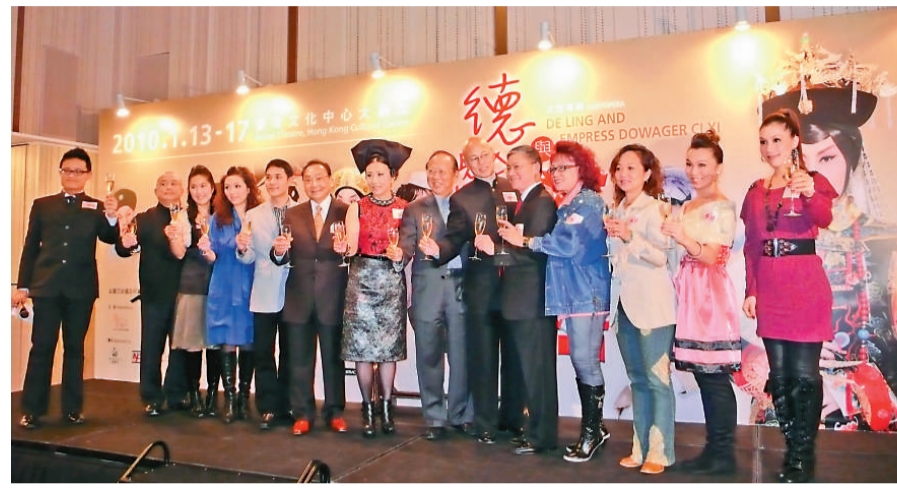
▲參與粵劇《德齡與慈禧》演出的前輩與新進演員大合照

粵劇《德齡與慈禧》將於明年一月十三日至十七日在香港文化中心大劇院演出六場。門票於十二月二日起於城市電腦售票處公开发售。