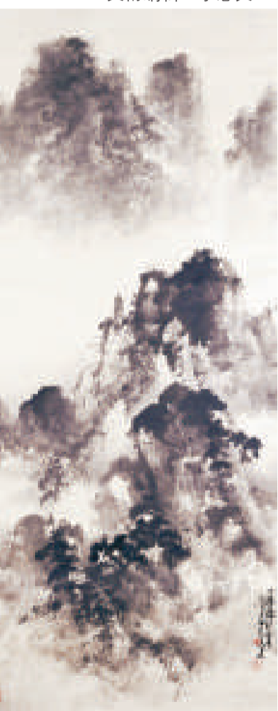
▲《層巒聳翠》(一九六七年)