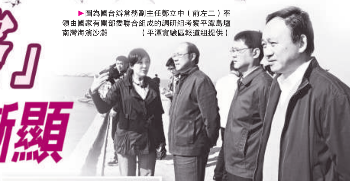
▲新竹市市長林政則一行和福州市、平潭綜合實驗區負責人共同參加祖國大陸距台灣島最近距離揭碑儀式