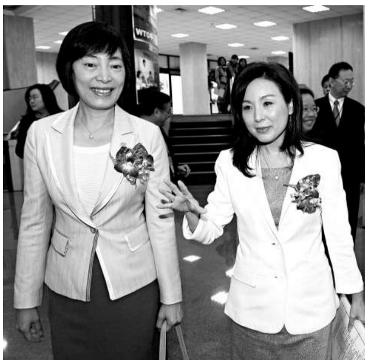
中國人行副行長胡曉煉（左）和台金管會副主委李紀珠兩人均是集年輕、智慧於一身的女強人

中國人民銀行副行長胡曉煉首度率團訪台，她表示，兩岸貨幣清算機制正由兩岸商業銀行準備中，技術準備程序已完成八、九成，希望兩岸貨幣清算機制可在ECFA前簽定。