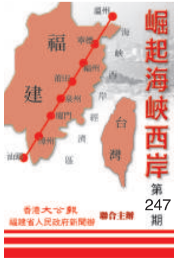
祖國大陸—台灣島 最近距離68海里

為支持平潭實驗區建設，各項開放政策和扶持舉措近期相繼出臺。此前，平潭擬「設立海關特殊監管區域」、「比照港澳做法給台灣車輛掛兩地牌或平潭特區車牌」等特殊化政策曾一度引發外界矚目，如今一些更為細化的支持舉措也已陸續出臺。