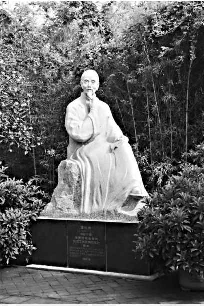
淄川是「世界短篇小說之王」蒲松齡的故鄉

淄川是清代著名文學家、「世界短篇小說之王」蒲松齡的故鄉。一部《聊齋誌異》為世人留下了一個個膾炙人口的鬼狐神妖的故事，廣為流傳，先後被譯為英、法、日、俄等26種外文版本發行，也使聊齋文化飲譽海內外，深受世界各國人民的厚愛，《畫皮》、《竊小倩》、《小翠》等經典文學形象廣為人知。從2003年開始，一年一度的中國（淄博）國際聊齋文化旅遊節、聊齋民間藝術燈會、聊齋文化藝術品博覽會等活動，吸引數十萬中外遊客前來參觀遊覽，以蒲松齡故里、故居、聊齋故事為主線的聊齋旅遊，充分展現了蒲松齡及其著作的文化內涵和底蘊，也打響了聊齋旅遊品牌。