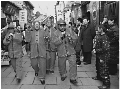
周村古商城裡的民俗活動

百年商埠重鎮周村，歷史源遠流長，文化底蘊深厚，人文薈萃，景色優美，是一座商業文化濃郁的城市，她是陸上「絲綢之路」的起點，是電視劇《大染坊》故事的發生地，曾有「金周村」、「旱碼頭」的美譽。在明清時期周村發展成為中國北方的重要商埠，有「天下第一村」之譽。厚重的歷史和淳樸的人文滋養出了一顆魯中明珠——周村古商城。「周村古商城」是國家4A級景區，可與山西平遙古城相媲美，景區內保留下的來的明清古建築5萬平方米，以保存完好的明清商業建築為主，建築風格具有多元化特點，集中體現了明清以來東西方商業文化交流的歷史積澱，被譽為「中國活着的古商業街市博物館群」，集中展示了深厚的魯商文化、建築文化、絲綢文化、民俗文化、宗教文化，並成為電影《活着》，電視劇《大染坊》、《旱碼頭》、《大觀園》等影視作品的拍攝基地。