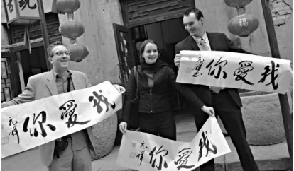
外國遊客遊覽周村古商城