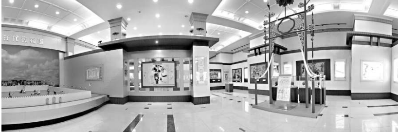
淄博臨淄是世界足球運動發源地，圖為臨淄足球博物館內景

內外首家專業足球博物館，濃縮了中國的蹴鞠文化史、民俗發展史、體育文化史和世界足球史，是一部立體的足球文化百科全書。