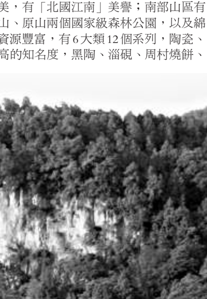
牛郎織女傳說起源地

淄博的北部平原彙集黃河下游風光之美，有「北國江南」美譽；南部山區有「沂源猿人」遺址和齊長城遺址，擁有魯山、原山兩個國家級森林公園，以及綿延數十里的溶洞群奇觀。這裡的旅遊商品資源豐富，有6大類12個系列，陶瓷、琉璃、絲綢、內畫、刻瓷等在國際上有較高的知名度，黑陶、淄硯、周村燒餅、博山酥鍋、馬踏湖金絲鴨蛋等遠近聞名。 齊風陶韻，生態淄博。這是一個古老而年輕的城市，厚重的文化，優美的風光，熱情好客的淄博人，熱切期待遠方朋友的到來。 淄博，歡迎您！