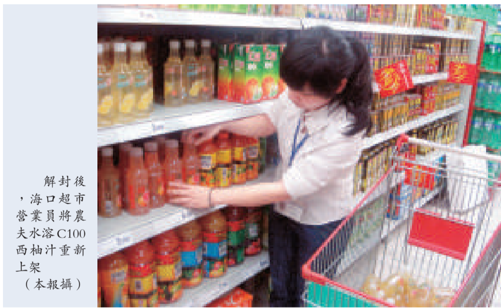
解封後，海口超市營業員將農夫水溶C100西柚汁重新上架

【本報記者曾媛園海口二日電】在海南初檢總量超標的農夫山泉和統一企業三種抽檢產品備份經由中國檢驗檢疫科學研究院綜合檢測中心複檢得出未見超標的結論，所檢產品全部合格。被海口市工商局叫停的農夫山泉和統一企業該批次「有毒」飲品今天上午八時正式「獲釋」，重返貨架。