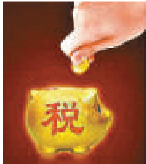
稅務總局發布公告首次對納稅人的權利和義務進行確認（資料圖片）

2日，來自陝西省地震災區4個市7個縣的100名鄉村醫生在西安的第四軍醫大學，開始為期兩周的培訓。由中國紅十字基金會舉辦的地震災區鄉村醫生培訓班開辦以來，已有500名四川、甘肅、陝西、雲南等地震災區的鄉村醫生接受免費培訓。 據介紹，「鄉村醫生培訓計劃」是中國紅基會「紅十字天使計劃」的重要組成部分，旨在動員社會資源，以公益籌款形式免費為鄉村醫生提供培訓。其目的是通過組織短期的業務培訓，提高鄉村醫生的醫療技術水準。 「鄉村醫生培訓計劃」實施以來，免費面授培訓的鄉村醫生涵蓋全國26個省區，