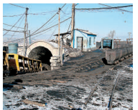
事故處理結束後煤礦將關閉（本報攝）

吉林省梅河口中和煤礦礦水（泥）事故，原定清除井下淤泥計劃暫時擱置，吉林省、通化市及當地領導與各位專家根據事故發生前後探空區內水位的嚴重變化以及巷道內全部瀰漫淤泥的事實，尤其是通過事故發生時井下生還礦工描述的逃生經歷，判定被困的16名礦工基本無生還可能。 （本報記者尹健）