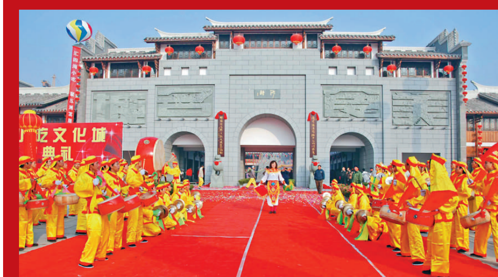
▲融小吃文化、旅遊觀光為一體的沙縣小吃文化城開城儀式熱鬧非凡 ▲「小吃搭台，經貿唱戲」，小吃文化節上的簽約盛況

據悉，2009中國（沙縣）小吃旅遊文化節將於12月6日至10日在福建省沙縣隆重舉辦，期間共安排4大類15項活動內容。其為，美食類4項：中華美食展銷活動、沙縣小吃技藝傳承暨品牌建設座談會、沙縣小吃業發展工作表彰大會、沙縣小吃製作技藝競賽活動等；旅遊類3項：「百團驢友（自駕車）激情沙縣遊」暨旅遊風光宣傳推介活動、福建省優秀旅遊縣合作聯盟活動、旅遊觀光考察活動等；文化類4項：總政歌舞團大型文藝演出活動、央視網友采風團現場采風系列活動、中國書畫名家書畫展暨中國書畫名家慈善助學活動、歷史文化圖片展和民間文娛活動等；經貿類3項：名特優產品系列展銷暨車房展活動、項目招商簽約暨參觀考察活動、重大項目開、竣工剪綵慶典活動。12月8日上午舉行隆重的開幕式暨重大項目簽約儀式。