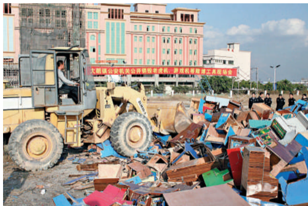
雖東莞嚴打「老虎機」賭博，但屢禁不止

另外，南方華人慈善盛典頒獎晚會2日晚在廣州舉行。馬萬祺、陳漢士、吳惠權、郭嚴芳、陳經綸、王錦輝、何儒生、劉思仁、楊鄂恩慈（女）、何傑文等10人獲「慈善人物獎」，林百欣獲「慈善紀念獎」，香港台山商會獲「慈善團體獎」，楊潤獲「慈善明星獎」。今年當選的獲獎人為廣東社會公益慈善事業捐贈款物總計超過20億元。廣東省省長黃華華、中央駐港聯絡辦公室副主任黃蘭發等，與來自海外及港澳地區的50多名慈善人士和100多名僑胞出席了晚會。