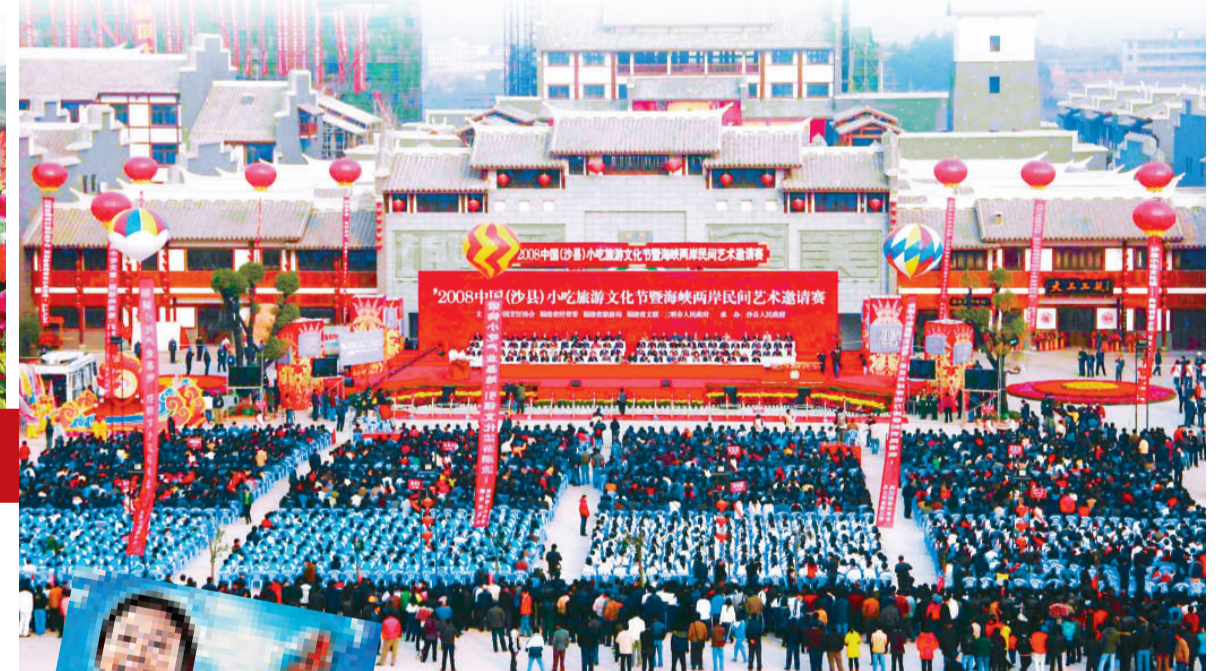
▲第十二屆中國（沙縣）小吃旅遊文化節開幕盛況 ▲首部反映沙縣人從事小吃創業的高清電影

2008年12月6日 投資1.8億元，融小吃、文化、休閒、旅遊觀光為一體的規模壯觀的沙縣小吃文化城開業；6日至9日，中國烹飪協會、福建省經貿委、福建省旅遊局、福建省文聯、三明市人民政府聯合在沙縣小吃文化城隆重舉辦第十二屆中國（沙縣）小吃旅遊文化節，同時舉辦海峽兩岸民間藝術邀請賽、中華美食展銷、沙縣鄉土菜比賽、小吃與旅遊文化發展論壇、小吃與旅遊書畫會等系列活動。