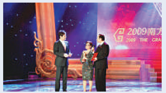
南方華人慈善盛典現場（本報攝）