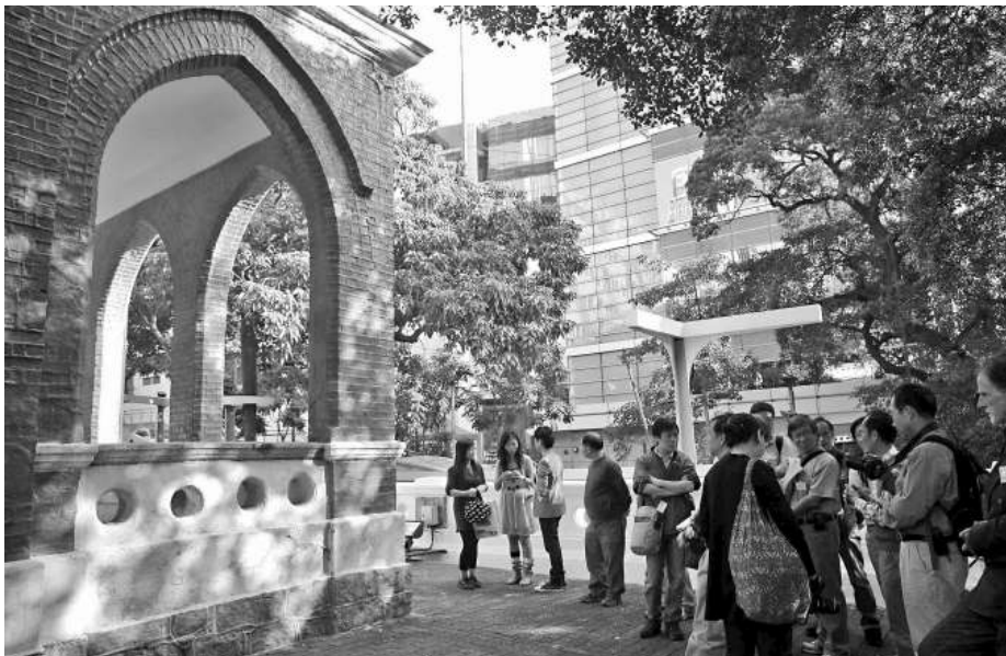
古物古蹟辦事處現在逢星期五舉辦導賞團