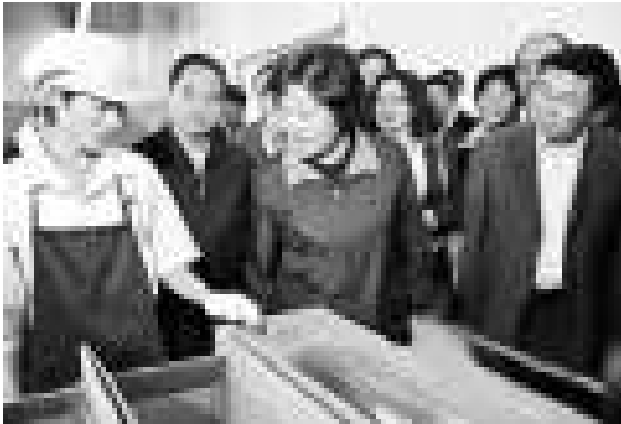
剛剛上任的福建省委書記孫春蘭，2日來到廈門就當前經濟社會發展情況進行調研。（網絡圖片）

東莞台灣事務局負責人表示，富邦銀行進駐不僅能提升對台資企業的金融服務水平，推進他們在東莞扎根發展的信心，也有利於加強莞台金融業直接交流合作。分析人士認為，金融合作在兩岸經濟交流比重日益加大，有利於富邦銀行東莞代表處加快升格為分行，擴充東莞融資服務能力以及提升台灣同胞投資的熱情。