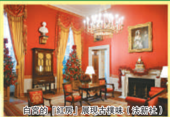
白宮的「紅房」展現古樸味