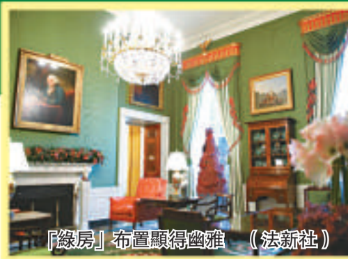
「綠房」布置顯得幽雅