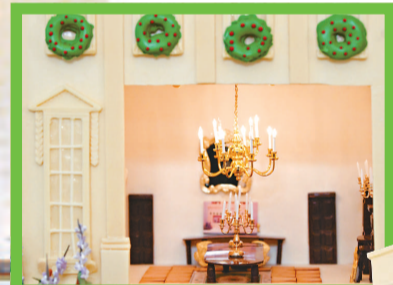
吊燈和傢具是以黑朱古力製成