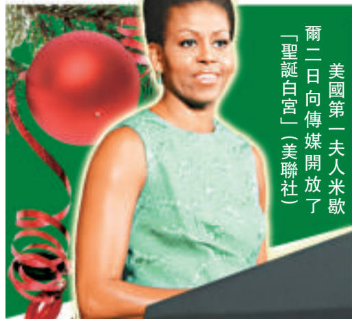
美國第一夫人米歇爾二日向傳媒開放了「聖誕白宮」