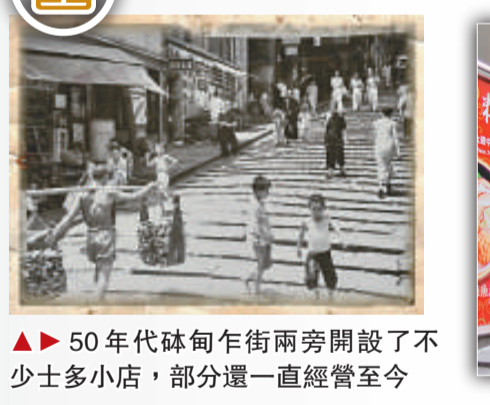
▲▶ 50年代砵甸乍街兩旁開設了不少士多小店，部分還一直經營至今