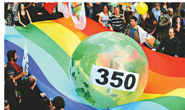
土耳其環保主義者展示寫有350的大氣球, 要求將污染環境的碳氣排放量減少至百萬分之三百五十