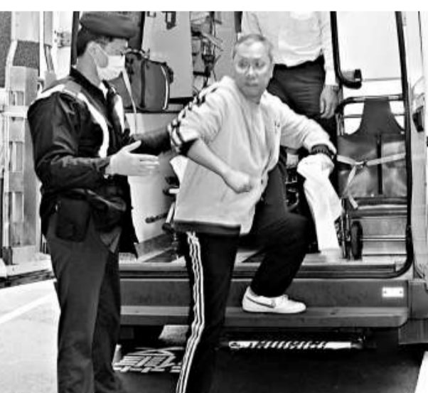
▲疑誤吞碎玻璃而送院的男子

疑誤吞玻璃碎男子年約五十歲，送院時連同載有血絲口水的膠袋，交由醫生檢驗。現場是九龍城道九十一號一間茶餐廳。昨午一時許，事主夫婦到該餐廳用膳，其時叫了粉麵及餐飲，未幾男子喝飲熱檸茶時，突然感到有微細硬物吞落喉嚨，心感有異即時頓喉大力吐出，並向侍應投訴，但有人否認並懷疑他「做戲」圖食霸王餐，雙方一度發生爭吵。同行妻子始終擔心丈夫安危，遂報警召救護車將其送院，事後食環署人員前來了解情況。