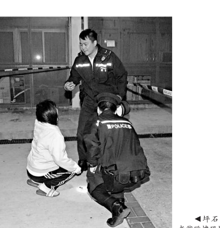
▲坪石邨老翁跳樓現場

死者姓黃，女性，三十一歲，香港人，前日入境。現場消息稱，警方昨日下午約五時半接報友誼大馬路金麗華酒店十七樓一客房內懷疑發生一宗吊頸自殺事件，治安警、消防、司警人員先後到場。調查後，司警局表示，司警人員到場後發現房門被反鎖，經消防員破門進入後，發現死者吊掛在所租住房間的浴室內，衣着整齊，現場發現遺書，懷疑涉及家庭問題。司警認為案件初步沒有可疑，詳情有待進一步調查。