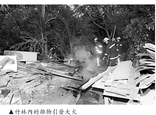
▲竹林內的雜物引發大火

事發昨清晨六時五十分，有村民行經該竹林時，發現有火舌四竄，將一批木板燒着，並有蔓延趨勢，可能禍及該泰廟，大為緊張報警。消防員到場即時拉喉，迅即將火撲熄，調查起火原因，相信與有人大意遺下火種有關，事件並無可疑。