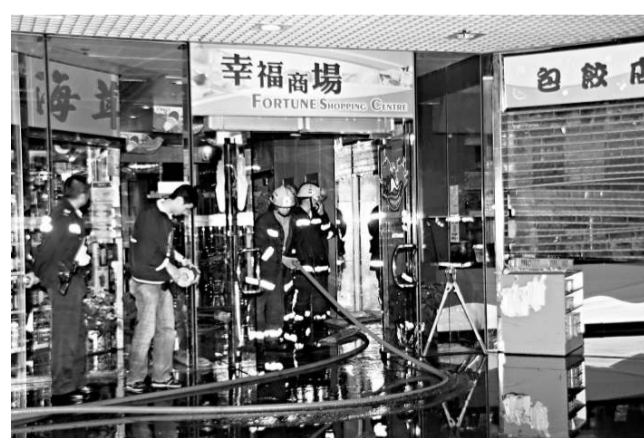
▲長沙灣食肆閉門失火現場

【本報訊】長沙灣幸福商場一間地舖食肆，昨日凌晨閉門失火，幸及時被人發現報警，消防員趕至破門入店撲救，迅即將火熄滅，事件起因疑電器短路引致無可疑。現場為幸福商場一間食肆，昨凌晨一時五十二分，有途人行經上址門外，嗅到陣陣燒焦異味，好奇心驅使追尋來源，發現該店內濃煙密布，相信發生火警即時報警。消防員趕至派員破門和出動煙帽隊入內撲火，火警隨即被救熄。店內雖沒嚴重焚毀，惟受水漬嚴重影響。消防員調查事件起因，疑電器短路引致，火警中幸無人受傷。