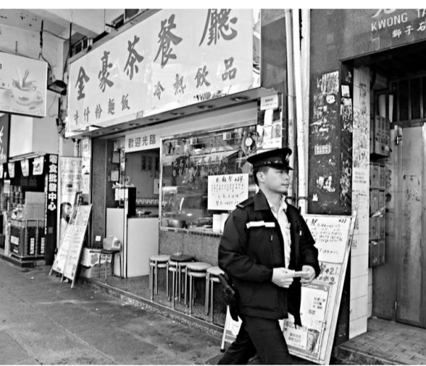
▲涉案的茶餐廳