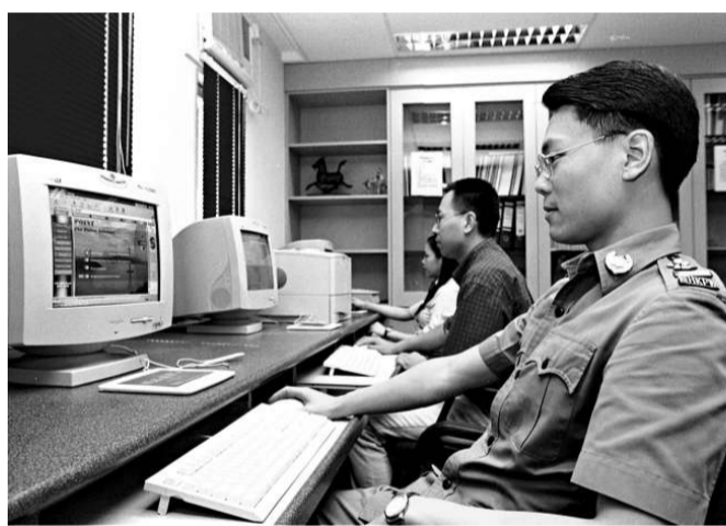
▲警方內部文件外泄事件近期一再發生

昨日已經連續第二日發現有警方內部文件在網上流傳，前日發現的六份文件。警方解釋是有警隊人員今年前將內部儲存文件放在私人電腦，但忘記刪除，導致外泄，警方會深入調查，如果有人違反內部守則，會採取紀律行動；並表示已經向部分當事人道歉。不過一位資料被外泄的舉會負責人昨日說，警方沒有任何電話或其他慰問表示；並稱，道歉並不重要，更加關心警方如何確保事件不再發生。警方表示，已經和私隱專員公署聯絡，會配合公署調查。