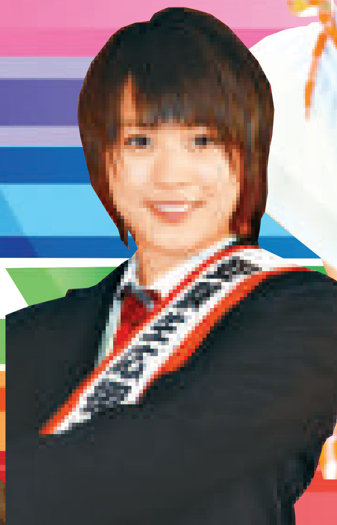
▲北乃紀伊將在明年二月推出處女單曲《櫻花開》 ▲北乃紀伊就任為考生啦啦隊隊長，為應屆考生打氣