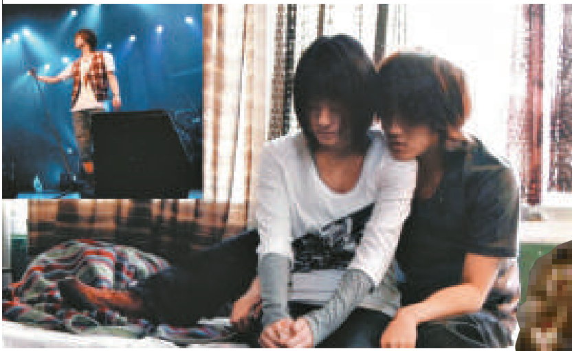
◀北乃紀伊（左）與赤西仁合演的《Bandage》預售反應佳，令北乃知名度提升

此外，北乃與「Kat-Tun」成員赤西仁合演的新片《Bandage》，預定於明年一月十六日上映，早前電影門票作公開預售，一日賣出七萬張之多，創下紀錄，雖然外界都把功勞歸於赤西仁的人氣，但相信北乃也可憑電影進一步提升知名度。