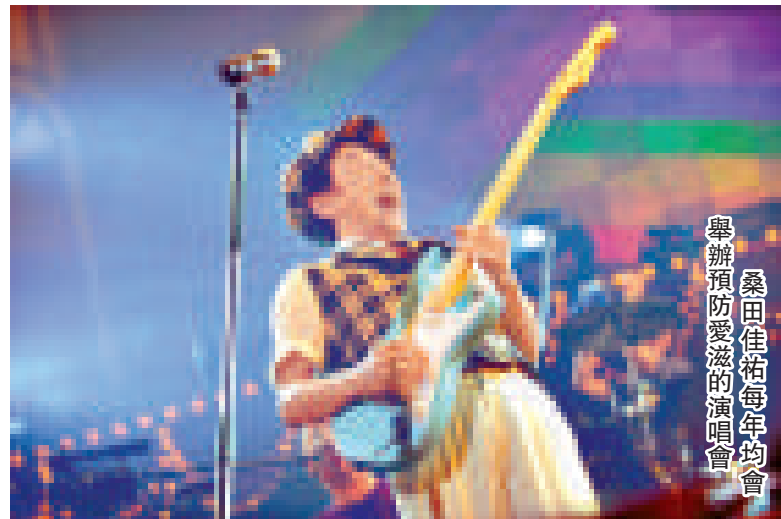
桑田佳祐每年均會舉辦預防愛滋的演唱會

演唱會的收益將會用作印製小冊子，在各小、中、高校，以及保健所等地，還有在愛滋教育活動等地派發，以提高市民對預防愛滋病的意識。