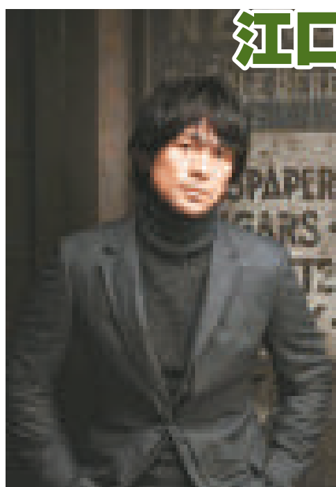
◀江口洋介將為節目任主持，與觀眾分析世界經濟

江口洋介宣布為東京電視台的紀錄片《Giga的黎明》擔任主持，明年一月起他便會接力，首次參與同類工作。紀錄片講述日本與世界的經濟現狀，一直以來都是由役所廣司擔任主持，而江口則擔當介紹人。江口早前在劇集《急症室24小時》第四季中的表現出色，其正義醫師的形象深入民心，因此獲電視台起用，而江口則說，自己對世界的各種情報也很感興趣，很樂意擔任主持一職，使自己也能增廣見聞。