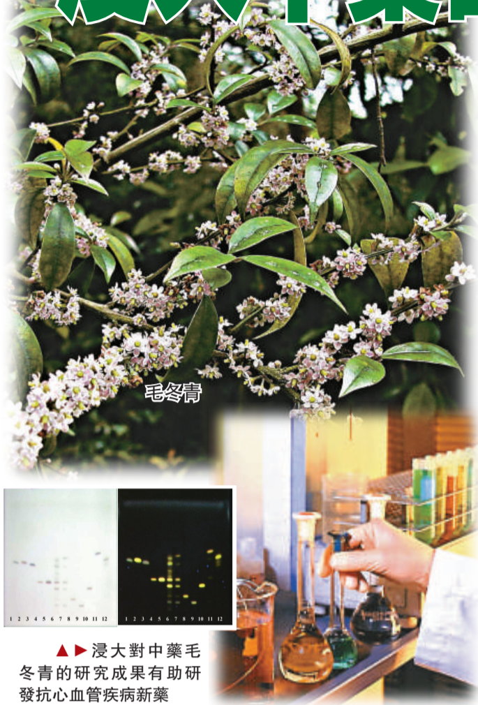
浸大中醫藥毛冬青的研究成果有助研發抗心血管疾病新藥

香港浸會大學中醫藥學院最近再有一項有關中藥「毛冬青」的研究，獲美國專利商標局授予專利權，是學院一年內第二項有關「毛冬青」的研究獲得專利權。