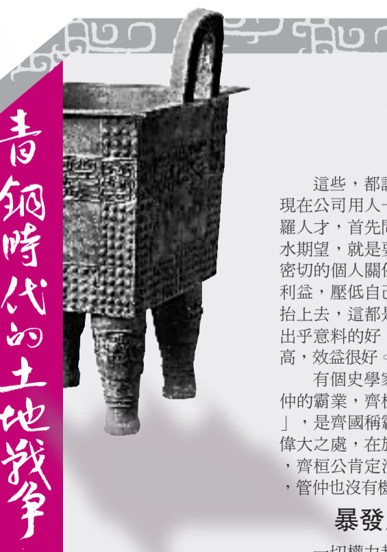
青銅時代的土地戰爭

此次為各國元首夫人定製的六十件旗袍全部由中國著名服裝設計師設計，六十件旗袍顏色、款式各不相同，在面料製作上也有特色，一旦完工，每一件都可是獨一無二的縹緞精品。加上設計費、材料費等，再算上收藏價值，一件旗袍的價格接近人民幣十萬元。