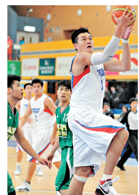
中華台北代表團對本屆東亞運印象良好