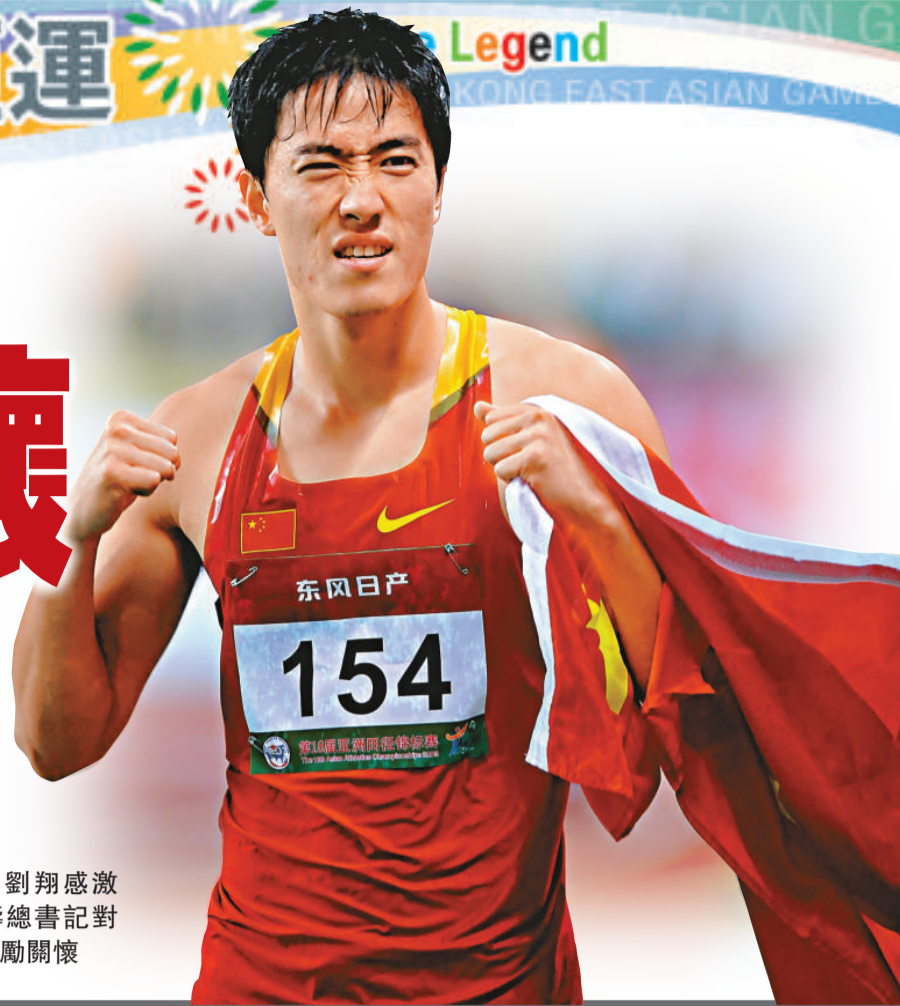
劉翔感激胡錦濤總書記對他的鼓勵關懷

【本報訊】中通社四日消息：第五屆東亞運動會5日將在香港開幕。即將出征的中國「飛人」劉翔，4日在個人網站撰文，回顧了復出兩個多月的經歷，尤其提到中共總書記胡錦濤在全國運動會上接見他時流露出的關切之情，令他十分感動。 劉翔說，復出兩個多月來，最讓自己難忘的是10月16日全運會開幕時，自己作為建國60年來優秀運動員的代表，受到胡錦濤的接見。 「我清楚地記得，那天總書記握着我的