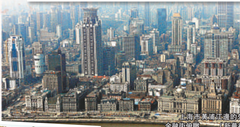
上海市黃浦江邊的外灘金融街俯瞰