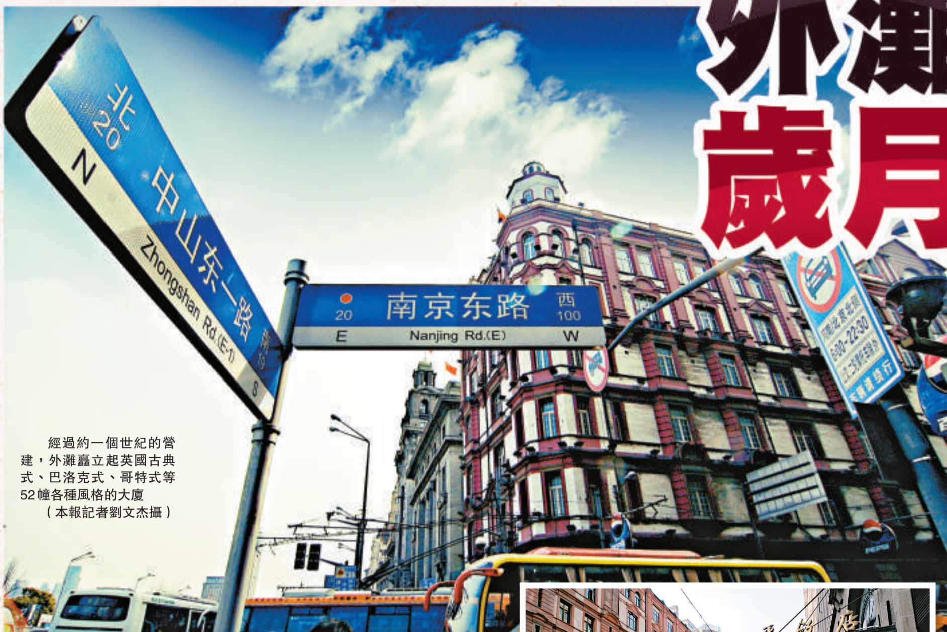
經過約一個世紀的營建，外灘矗立起英國古典式、巴洛克式、哥特式等52幢各種風格的大廈

150年前，當外國人踏足上海這塊陌生的土地時，就看了黃浦江這片江灘。於是，這條曾經是船夫與苦工踏出來的織道。經過百餘年的建設，高樓林立、車水馬龍。這裡古典主義與現代主義並存的建築，使外灘成為上海的象徵。 本報記者 劉文杰