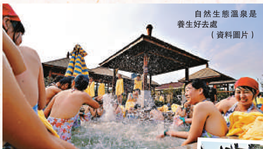
自然生態溫泉是養生好去處（資料圖片）

自駕線路：廣州—從化街口（在街北高速下或走105國道）—溫泉鎮—良口鎮米埔村（105國道左邊直入），全程大約1小時左右