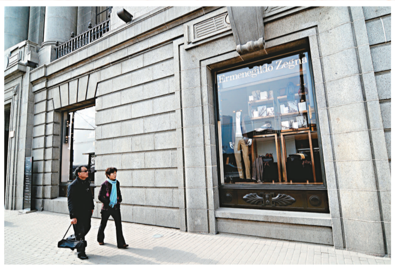
為上海最頂級的時尚地標