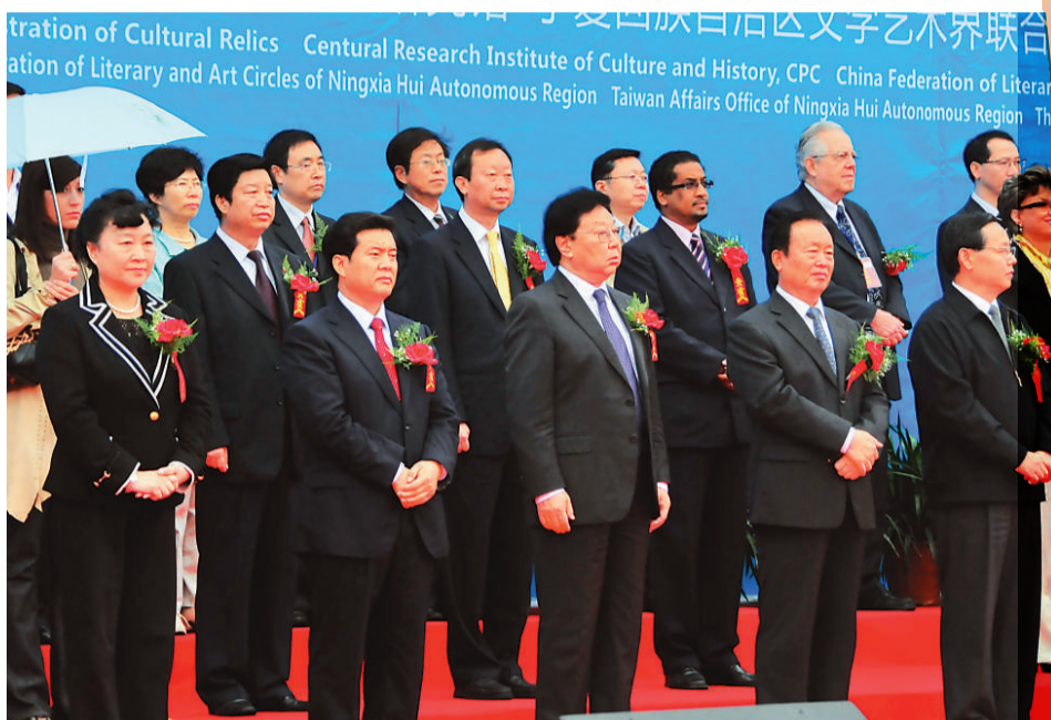
全國政協副主席鄭萬通（右三）、寧夏回族自治區黨委書記陳建國（右二）、自治區政府主席王正偉（左二）、文化部副部長趙少華（左一）等參加首屆中國寧夏國際文化藝術旅遊博覽會開幕式

日前，大型原創回族花兒風情劇《回鄉婚禮》亮相京城；回族舞劇《月上賀蘭》於2007年首演至今，已累計演出186場，接待國內外觀眾超15萬人次。經過第三次改編的舞劇《月上賀蘭》也正在全國巡演…… 文：田育紅