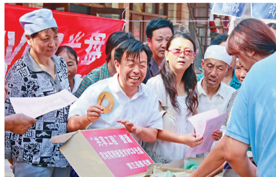
寧夏「共享工程」給賀蘭圖書館贈農村實用新技術光盤

結合寧夏區情，寧夏回族自治區黨委提出「小省區辦大文化」的目標要求。寧夏回族自治區政府主席王正偉指出：「歷史證明，真正能夠凝聚人心、鼓舞士氣的是文化。文化是文明的載體，文明具有超強的向心力。」