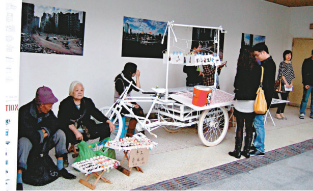
▲街邊攤文化