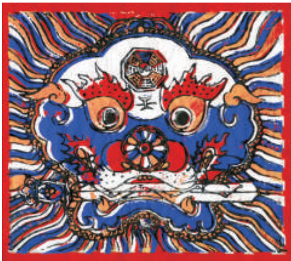
▲台灣台南年畫《獅頭銜劍》