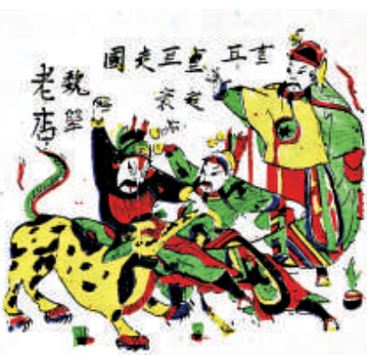
▲河南朱仙鎮年畫《重耳走國》 ▲天津楊柳青年畫《尉遲恭》 ▲天津楊柳青年畫《秦瓊》