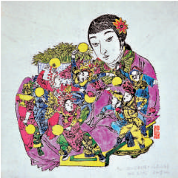
▲福建福鼎年畫《八大鍾》