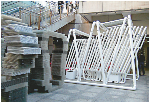
▲城市生態裝置《風聲水起》