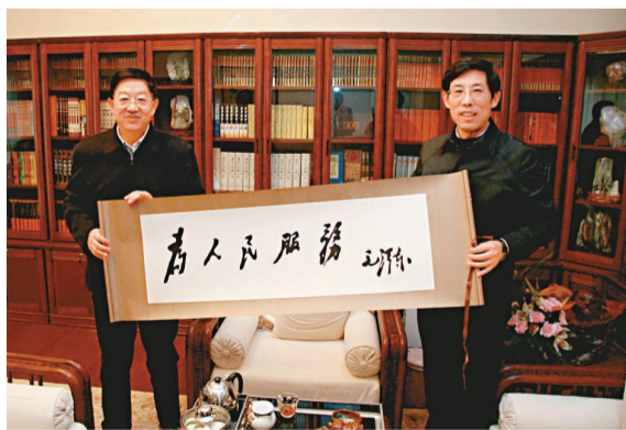
◀白恩培書記(左)會見姜在忠社長