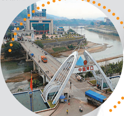
▲位於中越邊境雲南省河口自治縣的河口口岸

今年7月，國家主席胡錦濤考察雲南時提出的把雲南建成中國面向西南開放的重要橋頭堡的指示，讓雲南看到與南亞國家合作的光明前途。