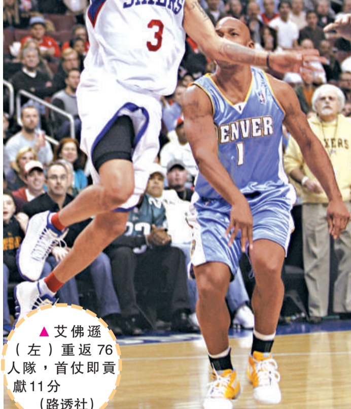
艾佛遜(左)重返76人隊，首仗即貢獻11分

【本報訊】綜合外電美國七日消息：艾佛遜在周一NBA常規賽作回歸76人後的第1擊，雖然他亦取得雙位數的11分，但76人最終主場卻以83:93不敵金塊，無奈遭遇10連敗。 艾佛遜在這場重返76人的首場比賽中以正選上陣，出場前他向在場爆滿的20664名球迷下跪致謝，更加親吻了曾效力10年的球場地板，顯示自己對76人的愛戴。在2006年離開76人的艾佛遜表示：「我覺得自己就好像返回家中，感覺真的很好。球迷的熱情反應，反而令我比以前效力時更加緊張；我喜愛這裡所有人，而他們也很喜愛我！」艾佛遜在1996年選秀中首輪第一順位被費城76人選中，他在2001年帶領76人隊闖入了總決賽，並當選了那個賽季的MVP。 艾佛遜今仗上陣37分鐘，全場11投4中取得11分，並作出6次助攻，隊友伊古奧達拿就射入31分，白蘭特錄得10分和13個籃板「雙雙」。不過金塊的比立斯也攻入全場最高31分、8個籃板和8次助攻，成為球